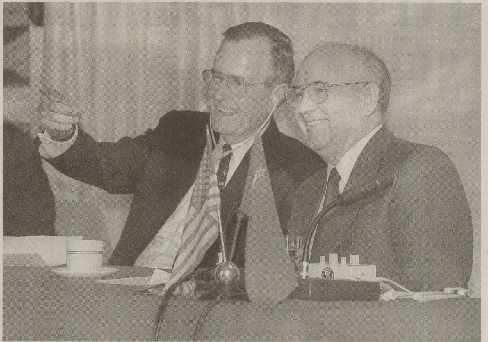
Protagoniștii n-au confirmat, nici nu au negat că ar fi vorbit punctual despre România.

De altfel – conform raportului DIE a Securității, datat la 2 decembrie 1989 – într-un recent interviu George Bush se referise astfel la România: „Aș dori să văd unele acțiuni și în această țară. Nu știu când se va întâmpla acest lucru. Am trimis în România un nou ambasador, Alan