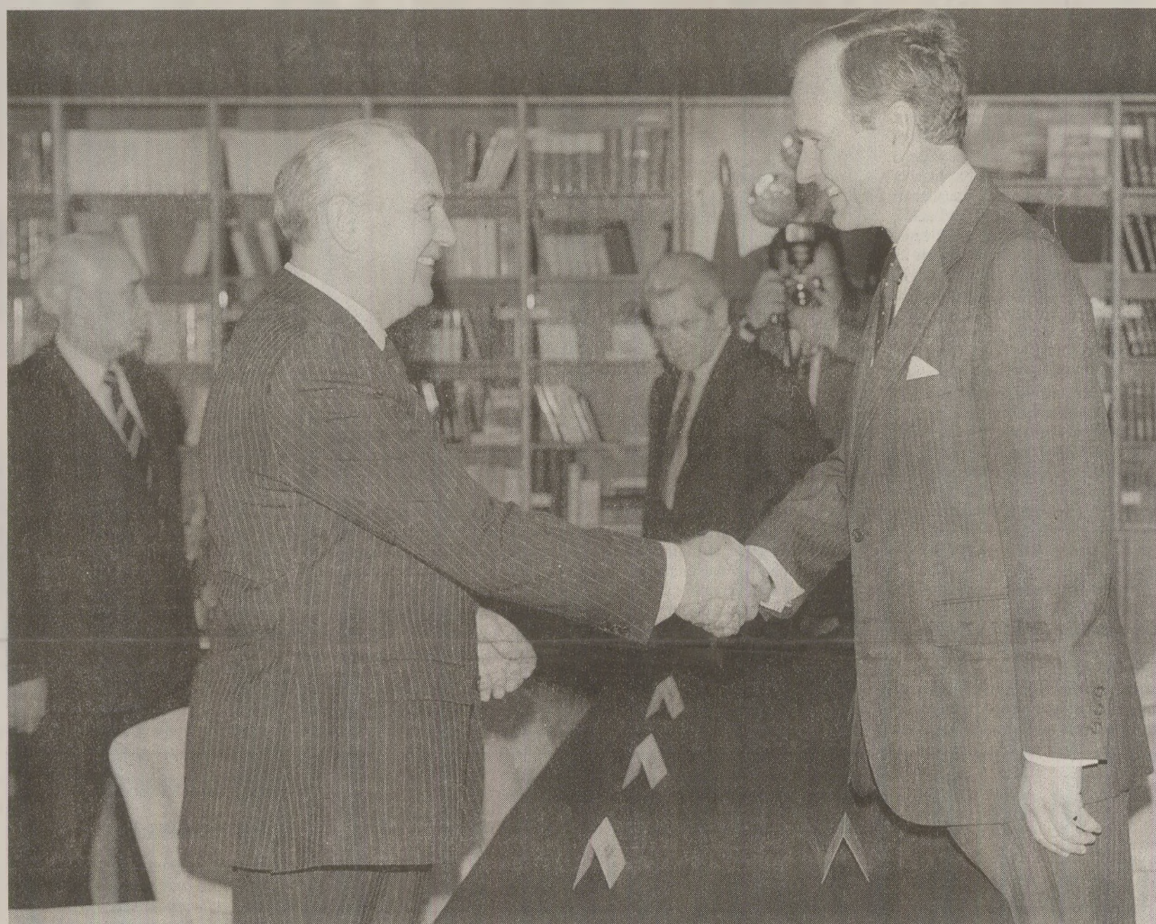
Anumite momentele ale întrevederii n-au fost consemnate, fiind „între patru ochi”, iar anumite pasaje înregistrate n-au fost făcute publice încă.

Cu referire la atmosfera întâlnirii a fost citată adesea versiunea lui M.R. Beshloss și S. Talbot. Distona „agitația” lui Ceaușescu printr-o celtă, au povestit consilierii lui Bush fără a-și fi citat sursele. „Tiranul sta-