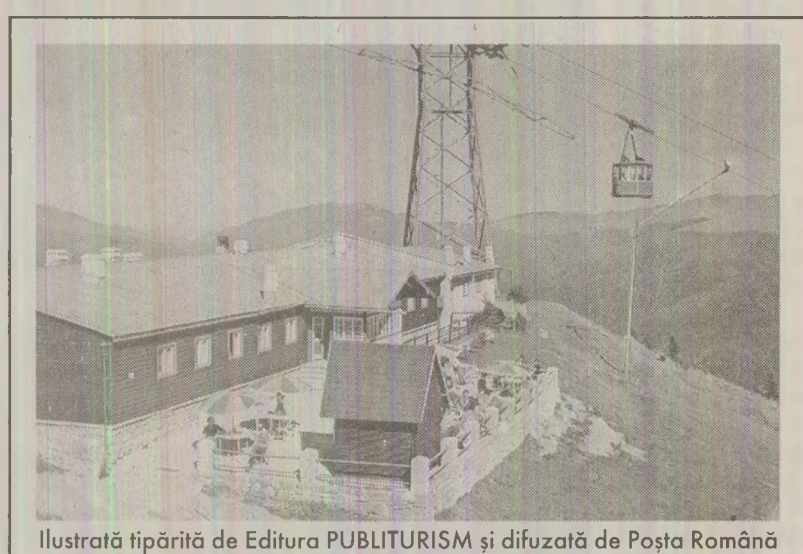
Ilustrată tipărită de Editura PUBLITURISM și difuzată de Poșta Română