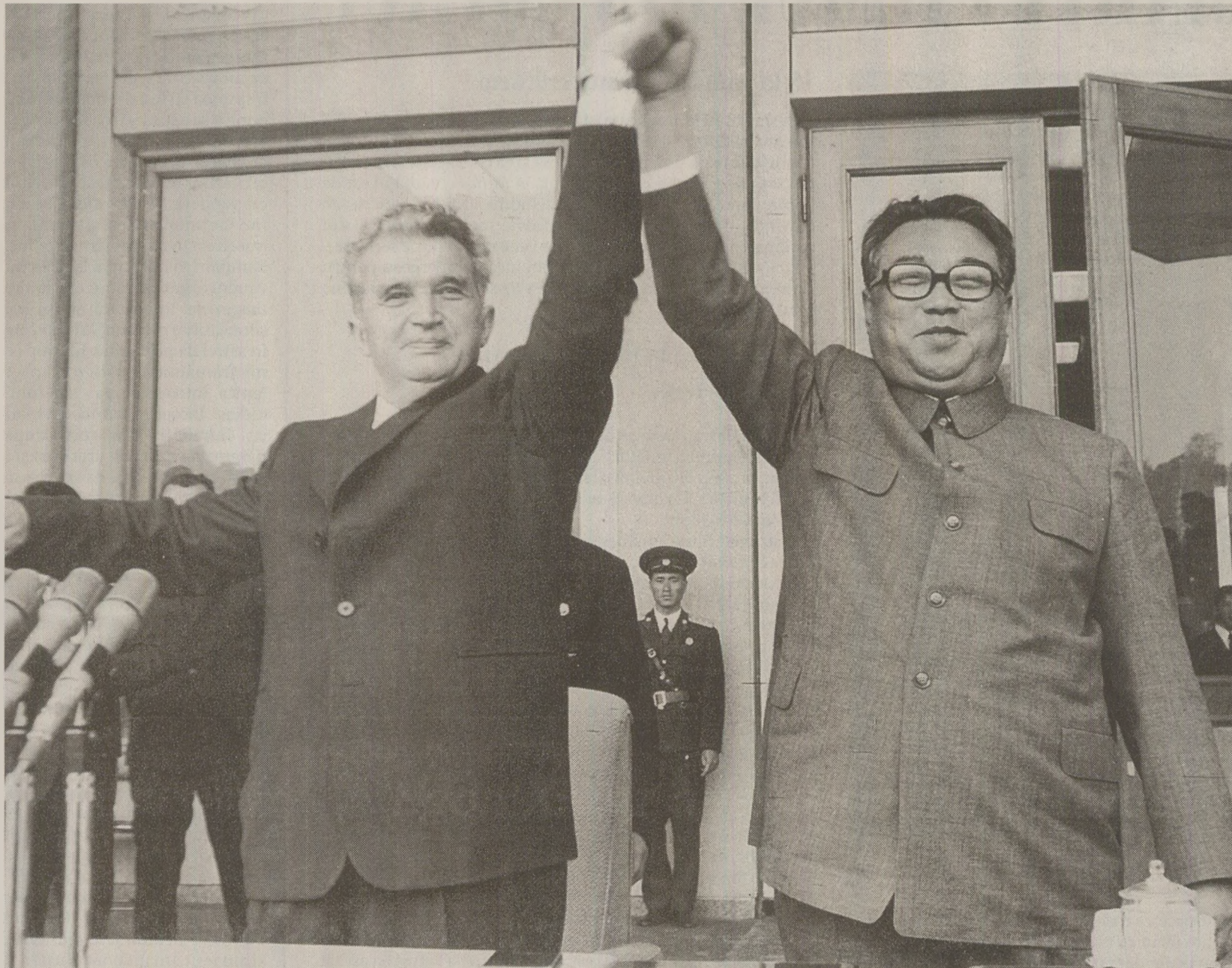
Dintre toți liderii comuniști, în ultimul an al puterii sale Ceaușescu nu mai seamănă decât cu nord-coreeanul Kim Il Sen

Mihail Gorbaciov, care a sprijinit schimbările din Germania de Est, Cehoslovacia și Bulgaria, nu poate face același lucru pentru România. În sfera economică, Vestul nu deține