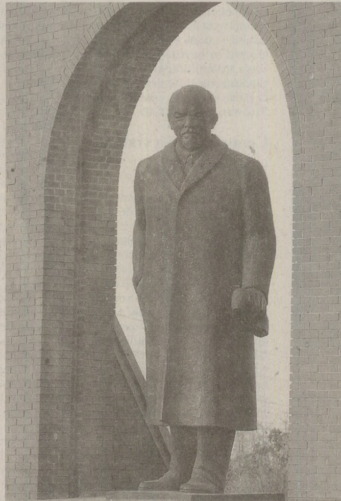
Dată jos pentru reparații, statuia lui Lenin n-a mai revenit niciodată în Piața Defilărilor din Budapesta