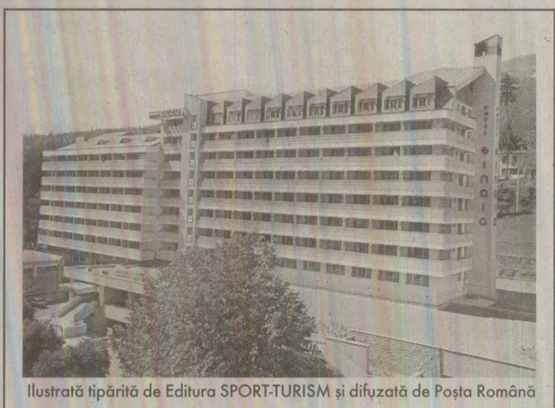
Ilustrație tipărită de Editura SPORT-TURISM și difuzată de Poșta Română