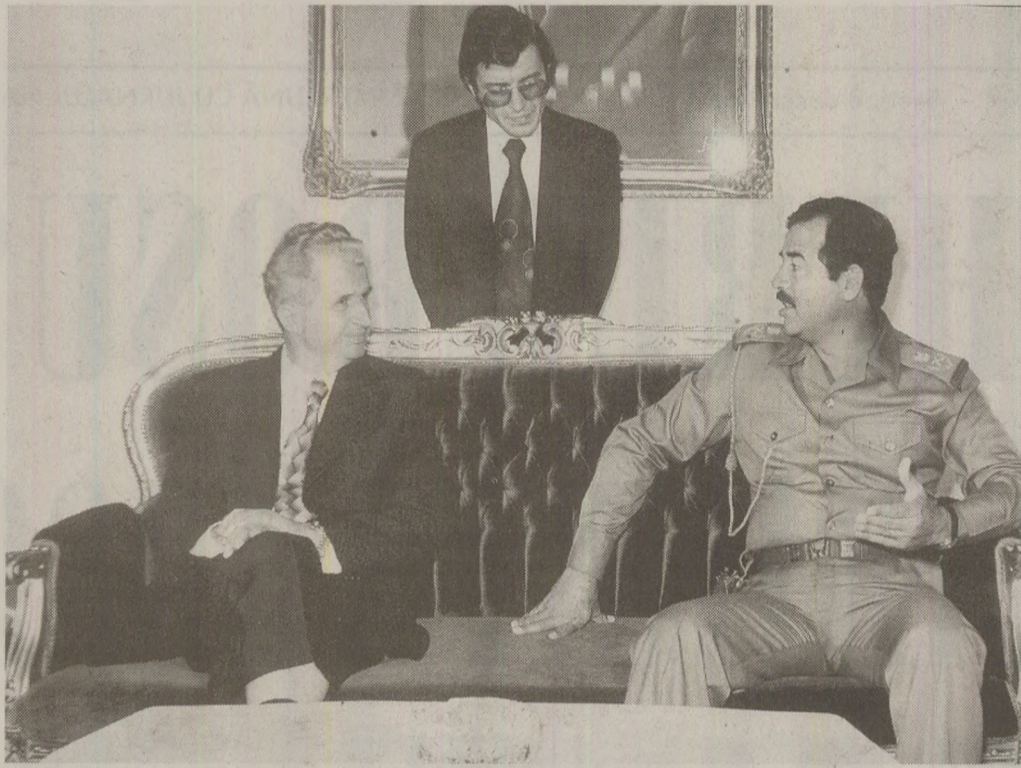
Din noiembrie până la capătul anului, România ar fi trebuit să încaseze peste 750 milioane de dolari din împrumuturi. În topul datornicilor conducea Irak-ul lui Saddam Hussein

„După ce plata datoriilor noastre s-a făcut, noi am făcut o serie de propuneri care însă nu au fost luate în considerare. Exportul nostru în 1989 era de 5,9 miliarde dolari. Plătim datoria încă din martie și rămăseseră 3,7 miliarde dolari. Ceaușescu nu a aprobat decât 1,2 miliarde pentru import, pentru industrie și populație, că nu mai aveam nici lame de ras, lapte praf pentru copii ș.a. și noi am ridicat atunci problema să se mai dea un miliard din excident pentru populație și să rămână restul pentru industrie, și să nu mai chemăm lumea sâmbătă, duminică, iar în cursul săptămânii să nu aibă de lucru. Dar s-a răspuns de mai multe ori că nu înseamnă că dacă am plătit datoriile să dăm drumul la curea și să mâncăm tot ceea ce producem. Nu vom face așa, a zis Ceaușescu. Mi s-a adresat direct că se va face un cont în bancă și în fiecare an să cumpărăm tone de aur pentru a reintregi tezaurul național al țării. Nu s-a gândit să modifice indicatorii principali din venitul național, și la Congresul al XIV-lea a spus că se va aloca 33% din venitul național pentru partea de dezvoltare, partea de investiții se făcea în dauna nivelului de trai al populației”.