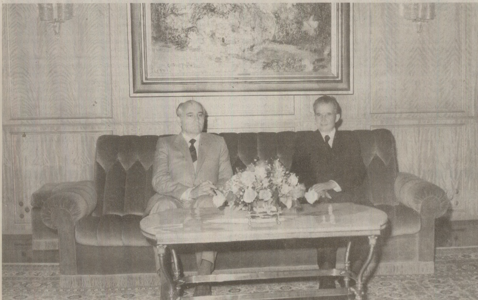
La ultima întâlnire, Ceaușescu i s-a lăudat lui Gorbaciov, care cerșea credite și ajutoare din Occident, că România are un excedent de miliarde de dolari

România a investit în China și America și are de încasat 2,7 miliarde de dolari, i-a spus Ceaușescu lui Gorbaciov. Prin exces de exporturi și sacrificii de „raționalizare” impuse cetățenilor, Ceaușescu reușise în martie 1989 să achite integral datoria externă a României. Înselând așteptările românilor, nu a slăbit însă deloc jugul privațiilor la care îi supusese. În decembrie, România avea de încasat 2,7 miliarde de dolari imprumutați și