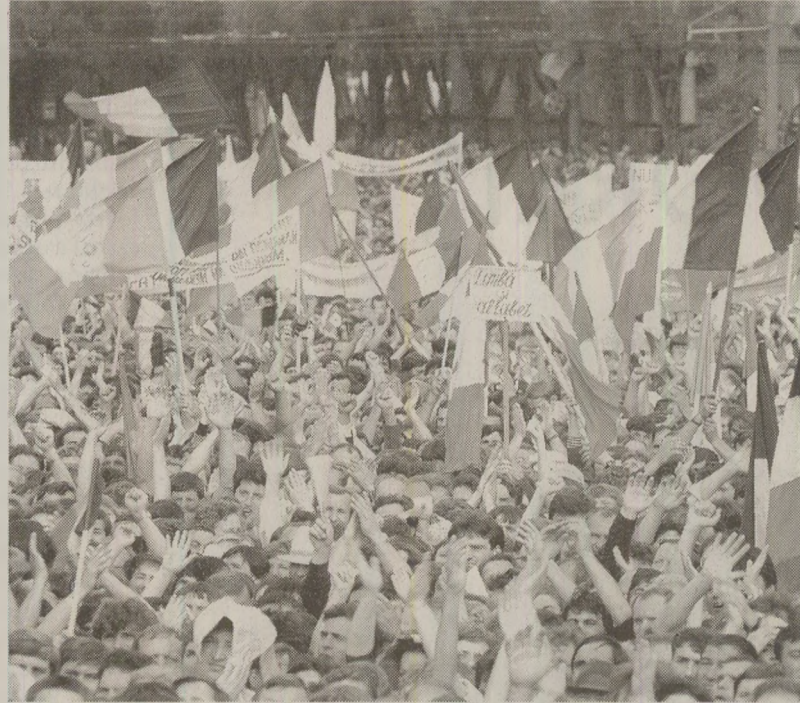
După manifestațiile naționale din vară, basarabienii au început să se intereseze de soarta românilor din granițele Ucrainei Sovietice