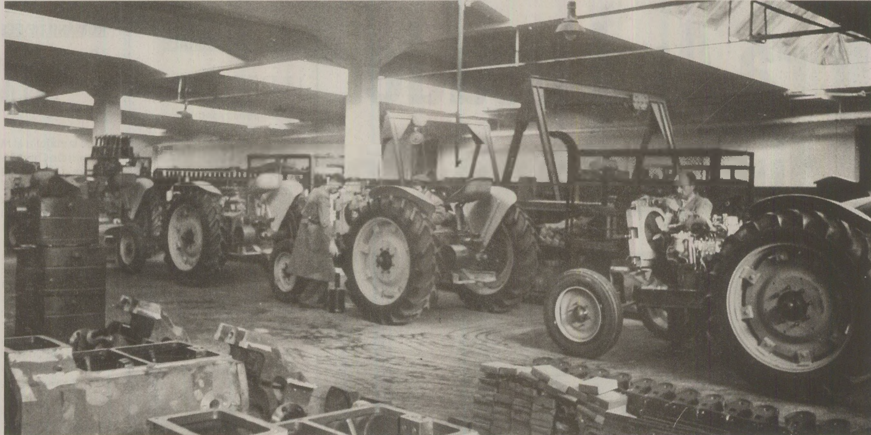
Filmele anului 1989 trebuiau să laude agricultura socialistă, „complet mecanizată”

Dintr-o bogată galerie de personaje, fiecare având trăsătură și psihologia sa, cu aspirațiile, frământările, indoliile, clarificările sale, se desprinde chipul activității autentice, lucid, ferm, responsabil, Dumitru