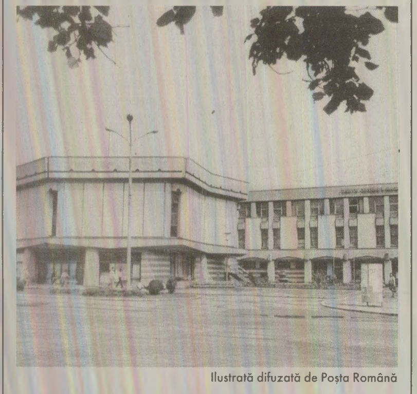
Ilustrație difuzată de Poșta Română