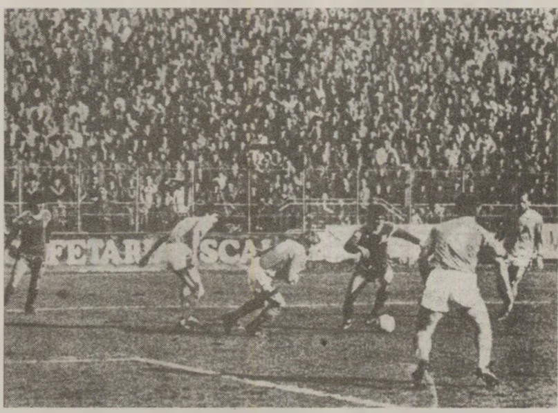
Steaua a cedat șefia clasamentului rivalilor de la Dinamo

FC Olt, locul 17. Însă amenințarea vine de la locul 10 în joc, echipele fiind înșiruite pe distanța a 2 puncte.