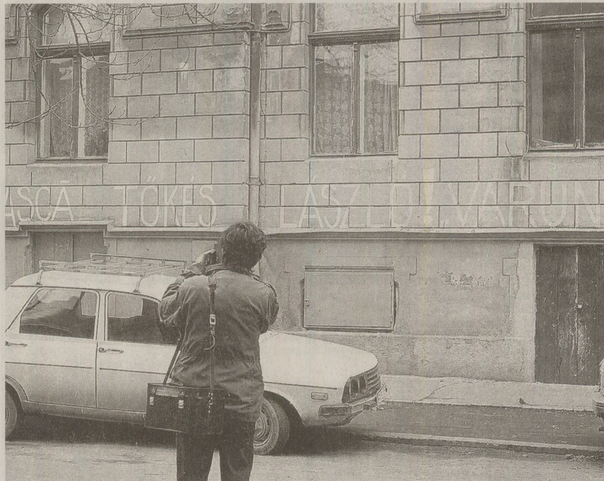
„Tulburările” de la Timișoara au început după o manifestare de susținere a pastorului reformat László Tokés, amenințat de regim cu evacuarea din oraș