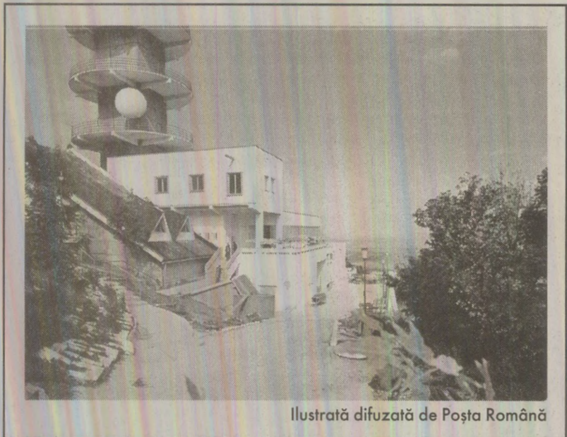
Ilustrată difuzată de Posta Română