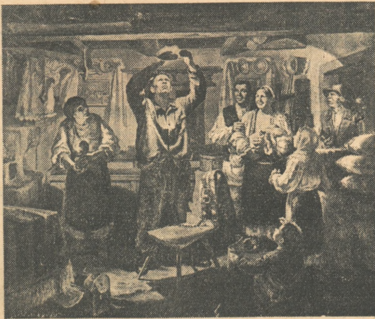
Lampa lui Ilici pictură de Avramescu Alexandru

„Lampa lui Ilici” a început să lumineze și satele patriei noastre. Urmând geniala învățătură leninistă, Partidul nostru a întocmit în anul 1950 Planul de electrificare a țării. Cu ajutorul Marii Țări a Socialismului, Planul prinde viață și lampa lui Ilici pătrunde pe rând până în cele mai îndepărtate colțuri ale țării.