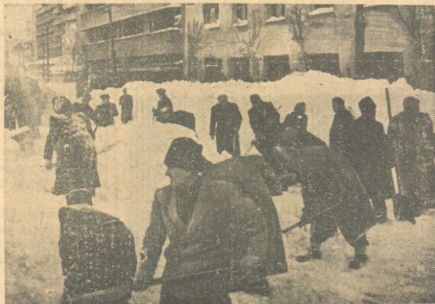
Oameni ai muncii din Capitală croind drum prin nămeți

Bătălia a fost câștigată. Din viscolul cel puternic n'au mai rămas decât mormanele de zăpadă așezate pe marginea drumurilor și căilor ferate. Orașele și satele și-au căpătat înfățișarea obișnuită. Trenurile se duc și se întorc, ducând cu ele călători și mărfuri. In orașe circula ca și înainte tramvalele și mașinile. Magazinele încărcate sunt pline de cumpărători. Iar cinematografele și teatrele pline de spectatori. Și in curând toate școlile își vor reîncepe activitatea.