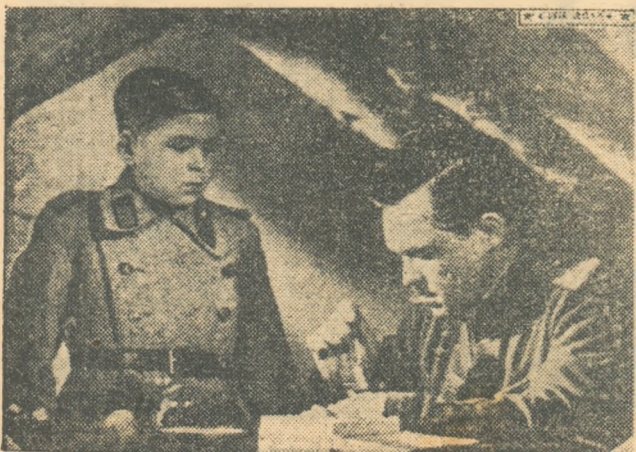
O scenă din filmul „Fiul regimentului”