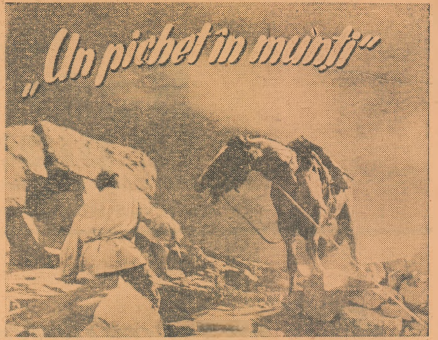
Film colorat, o producție 1953 a studioului cinematografic Mosfilm. Scenariul de M. Volpin și N. Erdmann, regisor C. Iudin

Undeva la hotarele patriei sovietice se întinde un finut străbătut de munți înalți și stâncoși, de câmpii mlăștinoase. Pe potecile înguste ale munților, printre trestii dese ale mlăștinii, cu greu poate răzbate picior de om. De câțiva vreme prin aceste locuri au început să apară călători cam ciudați, chipurile făcând parte dintr-o expediție arheologică. Aceștia nu sunt altceva decât spioni care, folosindu-se de banda lui Ismail-bec, vor să treacă granița în Uniunea Sovietică. Pentru a-și ajunge scopul, ei asmut bandiții împotriva pichetului de grăniceri... Iată-i acum pe grănicerii sovietici față în față cu banda lui Ismail-bec. Mlaștina răsună de împușcături. În despera-