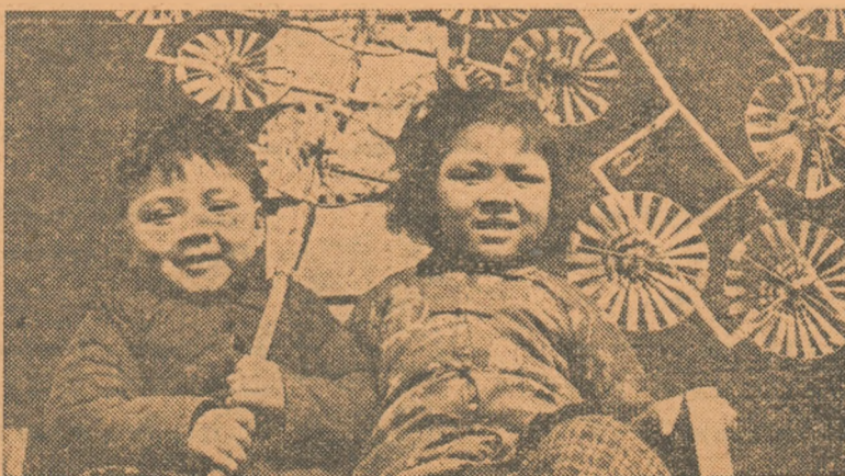
Doi copii au ținut să se fotografieze ținând în mâini rozele-morișcă pe care le-au cumpărat la bălciul din Ciangtin.

Zilele minunate ale „Festivalului primăverii” din Republica Populară Chineză s'au scurs în cântece, dansuri și veselie.