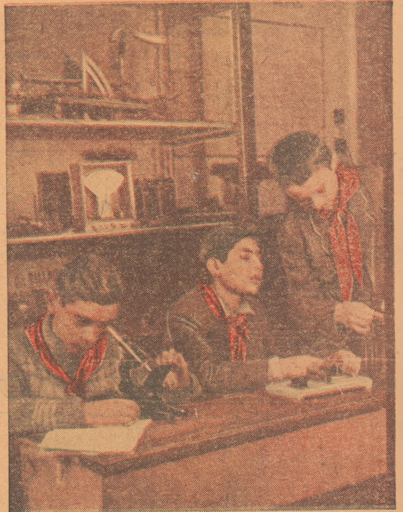
Un prețios ajutor în recapitularea materiei pentru examene vă sunt experiențele. Folosiți cât mai mult laboratorul școlii voastre.

O recapitulare bine făcută sistematizează cunoștințele. Ea este o încheiere a unei perioade de muncă și îți dă o bază solidă de plecare spre a cuceri noi cunoștințe.