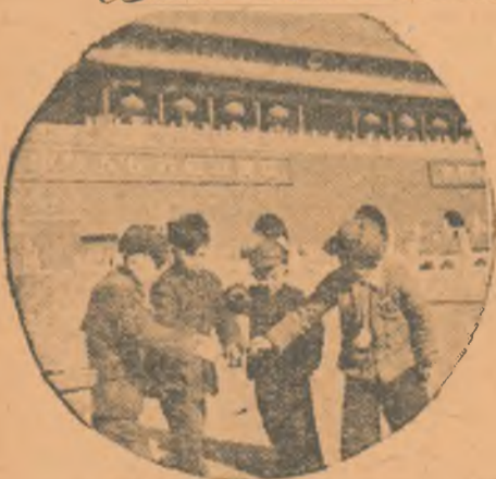
Iată un grup de copii jucându-se cu pocnitori în fața palatului Tien An Men.

În fiecare an, primăvara se revărsă peste fire, luminoasă și caldă, înveșmântând livezile, pădurea și lunca în haină verde sau smălțuită. Primăvara se taie brazdă în pământul reavăn și se seamănă boabele aurii ale belșugului. Primăvara întinerește natura, aducând cu ea gingășia și prospețimea florilor, zumzetul albinelor și hârjoana mieilor pe câmp.