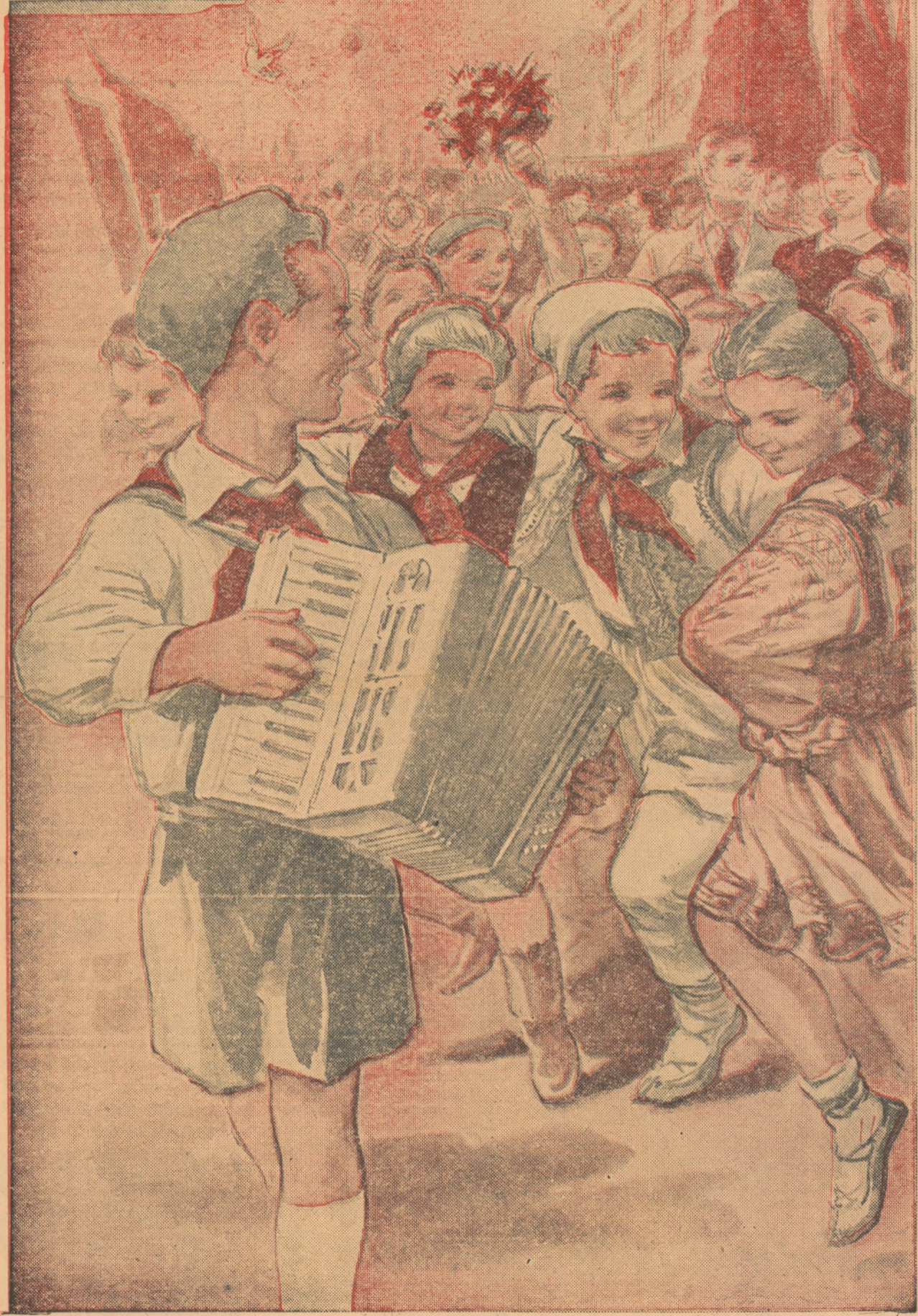
Desen de N. POPESCU Laureat al Premiului de Stat