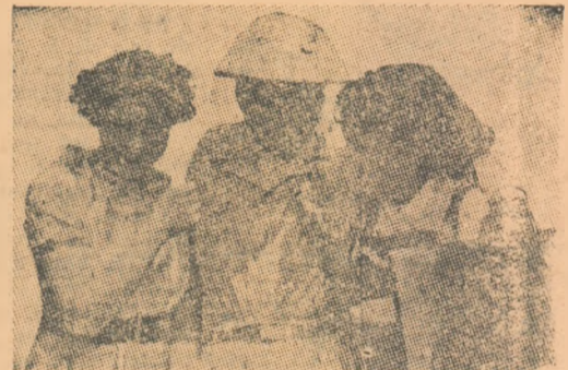
Acest tânăr vietnamez s'a întâlnit cu prietenii francezi la Festivalul dela București. Îi unește aceeași năzuință fierbinte: să înceteze căl de curând războiul din Vietnam. Prietenia lor e o părticică din prietenia popoarelor Vietnamului și Franței. Năzuința lor e a tuturor popoarelor lumii.