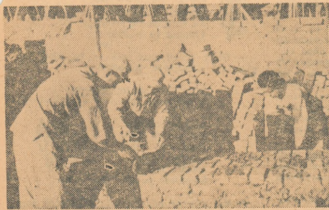
În Phenianul distrus de bombele americane, oamenii muncii zidesc locuințe, școli, uzine. Eroicul popor coreean pune temelii unei vieți noi, fericite, libere...

Poporul coreean și-a apărât libertatea cu hotărâre, cu eroism, cu jertfe mari. Tot timpul el a simțit din plin reazimul puternic și frățesc, solidaritatea uriașă a oamenilor muncii din lumea întreagă care au impus imperialiștilor încheierea armistițiului. Incredător în dreptatea cauzei sale, în prietenii săi, în victorie, poporul coreean a luptat neclintit și iată, azi, zorii unei vieți noi răsar în R.P.D. Coreeană.