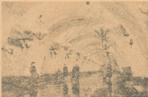
Stația „Arbatskaia” — a metroului din Moscova, de pe linia care leagă Piața Revoluției cu gara Kiev.

Zi cu zi viața oamenilor sovietici devine tot mai frumoasă, mai bună, mai veselă. Și poporul sovietic dorește ca pe întregul glob pământesc toți oamenii să trăiască în bună înțelegere și prietenie. Omul sovietic întinde o mână de prieten tuturor oamenilor cinstiți din lume. El a luptat și luptă mereu pentru ca pacea să triumfe în lumea întreagă.