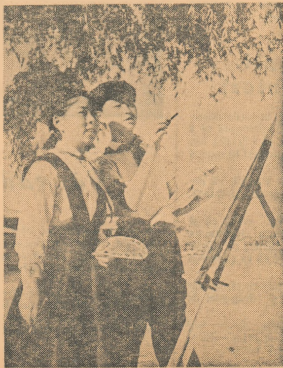
„Minunate sunt frumusețile patriei!” — Acești copii fericiți ai Chinei Noi se bucură din plin de viață. Căi întorșite li se deschid spre viitor.

Muncitorul chinez a devenit stăpânul patriei sale mari și bogate. În uzine, în fabrici, pe ogoarele întinse ale Chinei, clocotește munca voloasă a constructorilor vieții noi. În fiecare an crește numărul de eroi ai muncii. Pe pieptul lor strălucesc flori roșii de mătase, semn de răsplată și prețuire a devotamentului pentru popor.