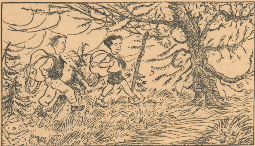
Desen de Nell COBAR

Petrică și Andrei au pornit în excursie. Intr'un luminis de pădure s'au ascuns un pui de urs, o veveriță, trei arici și o păsărică. Nu știu dacă Petrică și Andrei i-au văzut, pentru că animalele s'au pitit bine. Ajutați-i voi să-i găsească.