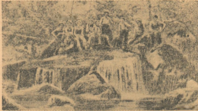
Scurt popas in taiga.

In ajun Volodea fusese de serviciu la bucătărie și pregătise, împreună cu Zina, masa de prânz. Pentru asta le-au trebuit numai vreo două ore. Ca să nu se plictisească până la întoarcerea copiilor, Volodea începu să-și facă ordine în rucsac. Chiar deasupra găsi un borcanăș în care fusese miere. „Uite, trebuie să-l spal!” —