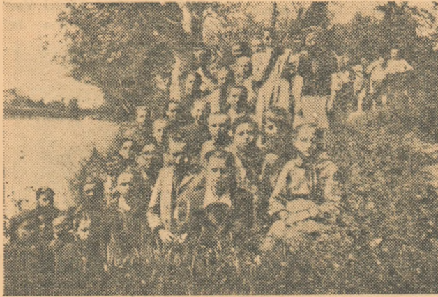
Popas pe malul Crișului

...O dimineață minunată de vară. În curtea școlii elementare răsună o goarnă pionierească. Pe străzile satului, copii echipați cu rucsacuri pline se îndreaptă spre școală. Aici îi așteaptă tovarășul profesor de Cultură fizică și sport. După ce s'au adunat cei 30 de excursioniști, echipa pornește la drum, iarba e încă udă de roua dimineții. Rând pe rând, școala, grădinile, livezile cu pomi fructiferi rămân în urmă. Drumul nu-i ușor. Cărarile serpuiesc adesea pe lângă povârnișuri abrupte. Ți-e și frică să privești în jos. Dar dorința de a ajunge cât mai repede la cascada calcaroasă din Meziad dă copiilor puteri noi. După un drum destul de lung, excursioniștii se află pe malul Crișului Repede. În față se întinde parcă o hartă geografică vie. Pot urmări cursul Crișului așa cum l-au învățat din paginile cărții. Unii își notează în jurnalele lor de unde izvorăște, cotiturile mai însemnate, locul