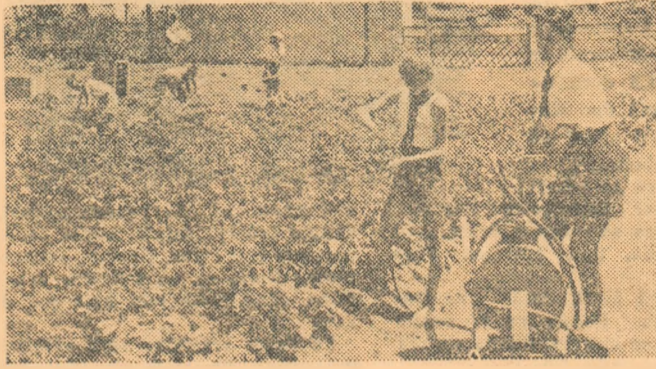
Tabăra orășenească de pionieri din apropierea Moscovei, dela Nahabina. Aici se odihnesc copii ai oamenilor muncii dela uzinele constructoare de mașini din Moscova. În fotografie vedem membrii cercului tinerilor naturaliști, lucrând în grădina de zarzavat din tabără.