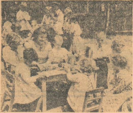
Grădinița de copii sezonieră a gospodăriei colective din Valea Roșie are astăzi oaspeți dragi — pionierii.

Cei mici vor petrece foarte bine în dimineața asta. Pionierii construiesc pentru ei o căsuță mică de carton, le citesc povești și îi învață tot felul de jocuri din cuburi.