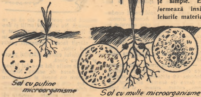
Sol cu puține microorganisme