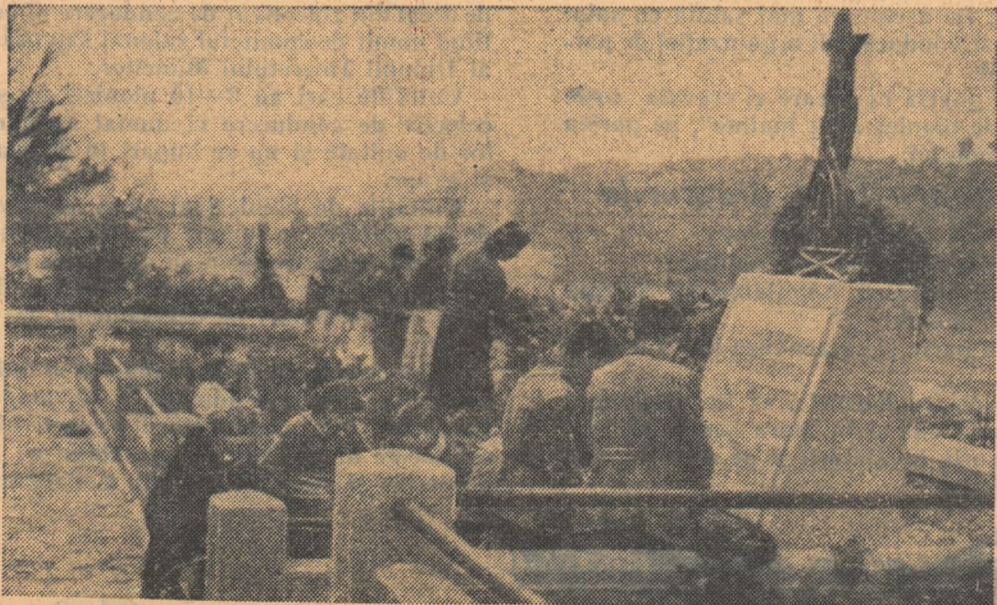
Îngrijind mormintele eroilor clasei muncitoare

Pionierii Unității Nr. 20, din comuna Telega, raionul Câmpina