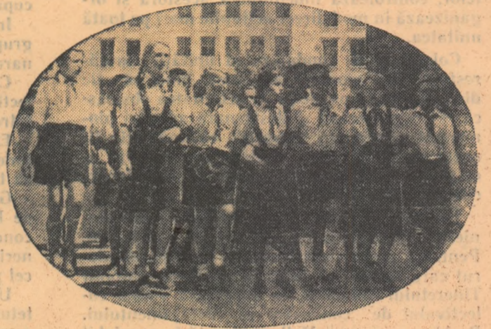
Veseli și tot mai fericiti este copilăria pionierilor din Republica Democrată Germană