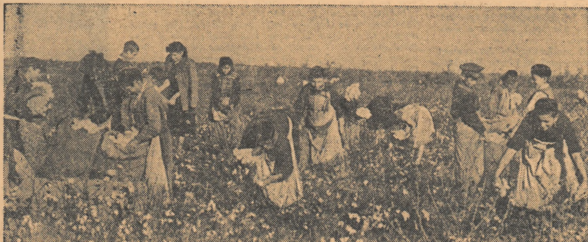
In zilele acestea de toamnă aurie, pionierii au venit la Gospodăria Agricolă de Stat Jegălia raionul Fetești să dea ajutor la strângerea bumbacului.

Pionierile și elevele Școlii de 7 ani Nr. 12 fete Galați