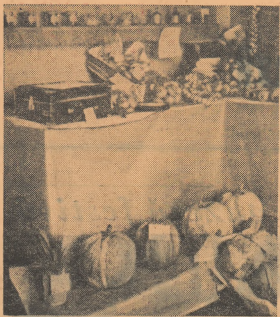
La expoziția agricolă raională din comuna Novaci au participat și tinerii grădinari din Dărăști, Singureni, Copaciu și Mihălești. In fotografie se pot vedea câteva din realizările lor.