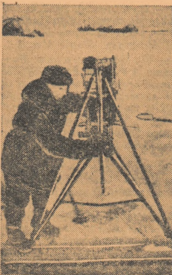
Se măsoară adâncimea oceanului

Încă înaintea lui Nansen, îndrăzneții cercetători ruși, deschiseseră o nouă cale navigabilă: în nord. Prin talentul lor, prin munca perseverentă și observații precise, calea navigabilă de nord a început să întâmpine tot mai puține obstacole iar în anii puterii sovietice a început să se navigheze fără niciun pericol. Dar zborurile și navigația în nord nu sunt totuși pe deplin posibile fără cunoașterea temeinică a naturii Centrului Arcticii, a celui loc unde se găsește polul. Până nu demult, pe hartă acest loc era însemnat cu o pată de culoare albastră închis, așa cum se vede dealtfel și în atlasele noastre. Judecând după scara adâncimilor înseamnă că aici, Oceanul înghețat atinge în adâncime mai mult de 4 kilometri. Spre acest loc au pornit din Unlunea Sovietică mai multe expediții științifice. Înfruntând cele mai grele primejdii oamenii sovietici au adus o neprețuită contribuție la cunoașterea temeinică a Arcticii Centrale. Expediția aeriană din 1937 condusă de savantul O. I. Schmidt, cercetările făcute de stațiunea științifică plutitoare a lui Papanin, călătoria spărgătorului de gheață „Gheorghii Sedov”, toate acestea au dus la înlocuirea unor păreri greșite,