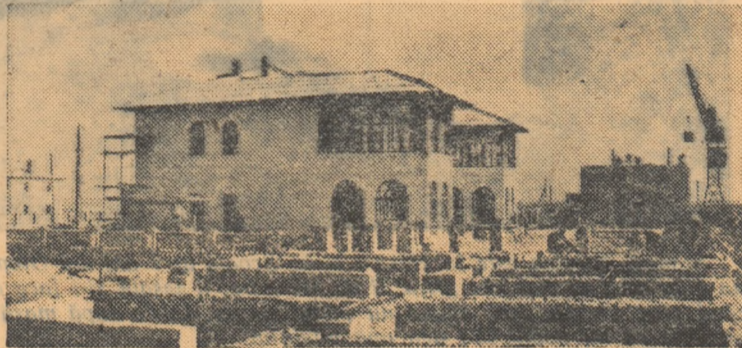
Construcții ale noului oraș Celeken.