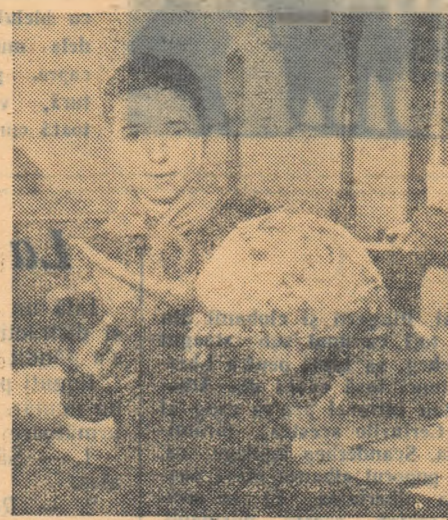
Ați mai văzut o asemenea varză? N'are nici mai mult nici mai puțin de 6 kg., și a fost crescută pe un lot individual de către pionierul Tănase Nicolae dela școala elementară nr. 159 din comuna Chtațna. Harnicul grădinar a mai recoltat de pe lotul său porumb, sfeclă furajeră și ridichi

Lulu SOLOMON Corespondent al „Scântei pionierului” în reg. Craiova