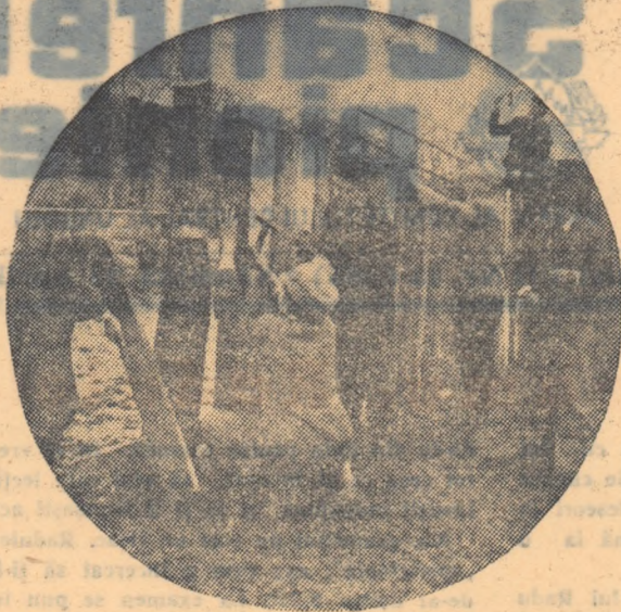
Pionierii Școlii Nr. 102 din București se pregătesc intens pentru 1 Mai. Ei au și hotărât să facă gardul lotului școlar și să-l vopsească frumos.

...Așa se face că tractoriștii din Zorleni au brăzdat până acum peste 2000 hantri. Pământ pe care se vor lega muncii curând spre cele dădora de rod.