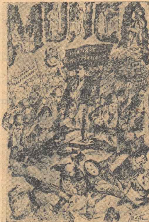
Numărul special al ziarului „Munca”, editat la București (1890) cu prilejul organizării pentru prima dată în întreaga lume a zilei de 1 Mai.

Era 1 Mai 1886. Trei ani mai tîrziu, în 1889, la Paris, avu loc primul congres al Internaționalei a II-a. Acolo se hotărî ca ziua de 1 Mai în care avusesse loc uriașă manifestație din Chicago să devină o sărbătoare a proletariatului mondial. Nu o sărbătoare oarecare, ci o sărbătoare revoluționară, o sărbătoare a unirii proletariatului din lumea întreagă, în lupta necrutătoare contra burgheziei. Și așa s'a făcut.