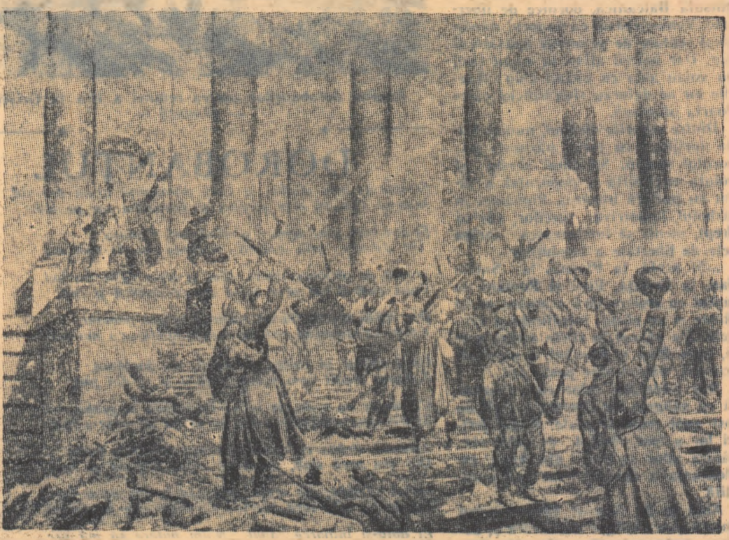
Victorie! Reichstagul a căzut.