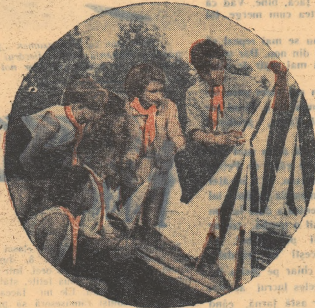
Tinerii navomodeliști în parcul pionierilor „Ernst Thälmann” din Berlin.

„Vrem excursii nu marșuri soldărești” spun miile de tineri din Germania Occidentală manifestând împotriva celor care pregătesc un nou război.