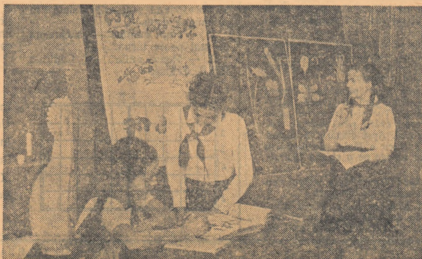
Urmărind colecția de plante din ierbar și planșele expuse, pionierile clasei a VI-a dela Șc. de 7 ani Nr. 124, repetă la Botanică.