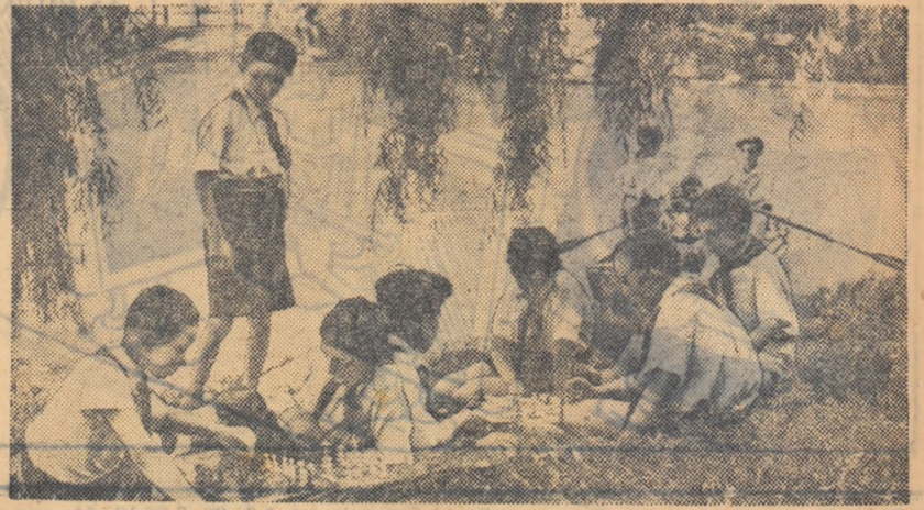
...în locuri răcoroase. Vom petrece zile plăcute!

Plantele... pe pământ Picături mari de ploaie udă din belug pământul însetat. Ca un burete, pământul sugă apă tot mai înăuntrul lui. Și când prin straturile de rocă, picăturile de ploaie dizolvă, iau cu ele substanțe hrăni- toare. Astfel încărcate ajung la rădăci- nile plantelor. Și iată că de aici picăturile iau un alt drum. Absorbite de plante ele urcă spre frunze... În sală se aprinde lumina. Se perete nu se vede decât o pânză albă, iar în spatele nostru un aparat de proiectie. Da, la pregătirile noastre pentru examene, am chemat în ajutor și aparatul de proiectie. The Pusu Șc. de 7 ani din com. Mihăileni Raionul Dorohoi