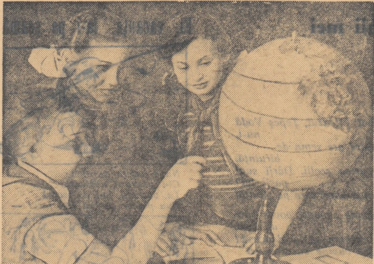
Ne-am pregătit temeinic