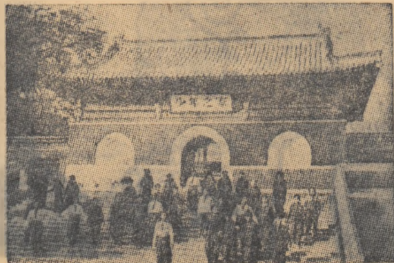
Palatul pionierilor din Pekin

— Astăzi, bunăoară, am ascultat o conferință despre înmulțirea plantelor și despre metodele de sădire a lor. După aceea ne-am ocupat de răsădirea ortensiilor și a belșitelor. Pentru că toate acestea le-am făcut cu