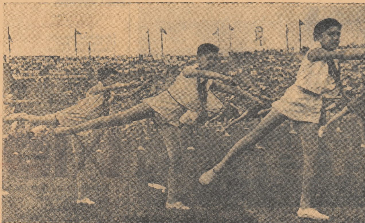
Eri a avut loc pe stadionul „23 August” din București serbarea sportivă organizată în cinstea sfârșitului de an școlar și a celui de al V-lea Festival dela Varșovia. In fotografie puteți vedea un aspect din „Repriza pionierilor”.