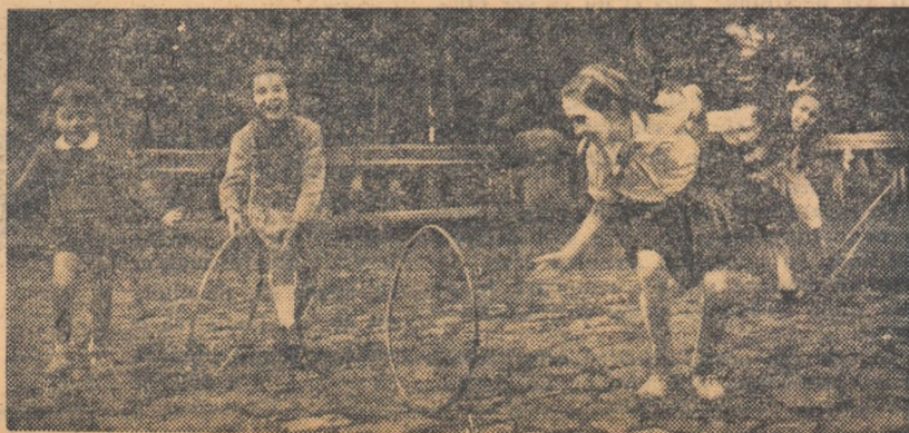
Cei mici își au colțul lor în tabăra!