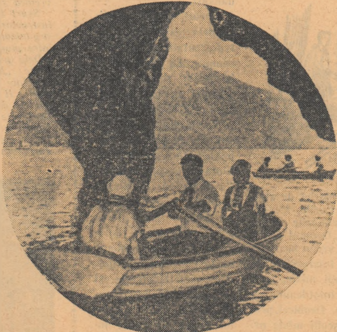
Sub bolțile grotii Pușkin

UN SPECIALIST „IN SUFLAT” Vacanța e ceea ce imi produce o înțepenie la fălcilor.