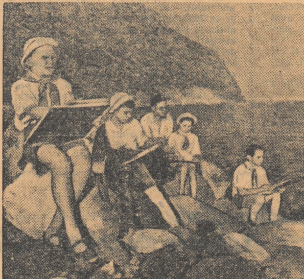
Tinerii pictori caută locurile cele mai pitorești și învață să deseneze după natură.

Aici copiii se întăresc și cresc oameni puternici și sănătoși.