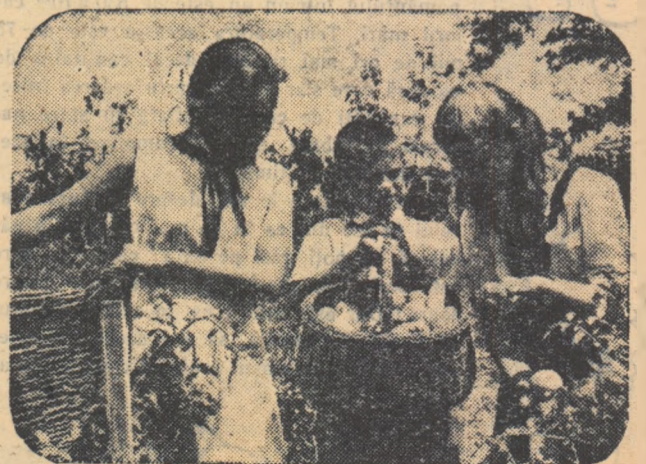
În grădinile gospodăriilor colective și de stat se recoltează legumele. Pionierii au venit să dea și ei o mână de ajutor.