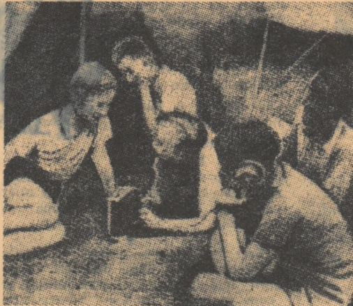
Ce plăcut e să ascuți muzică seara, în cort. Pionierii din R. D. Germană nu se lipsesc de aparatele de radio, construite de ei, nici în excursie.

„Gergö” — Vede Tot, Știe Tot” (Din „Pajtas” — gazeta pionierilor din R. P. Ungară).