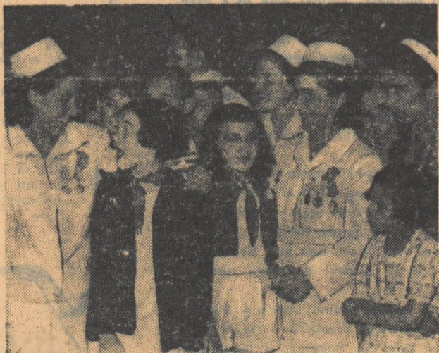
„Când vă veți întoarce dela Festival, să transmiteți un salut voios pionierilor Albaniei!” i-au rugat pionierii români pe delegații albanezi în trecere prin țara noastră.