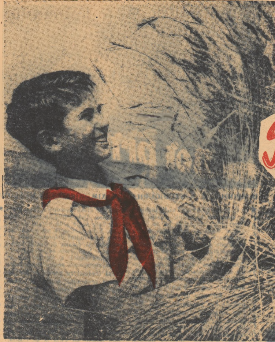
SNOPUL E GATA!

Anul VII, Nr. 60 (412), Miercuri 27 Iulie 1955 * 4 pag.; 15 bani