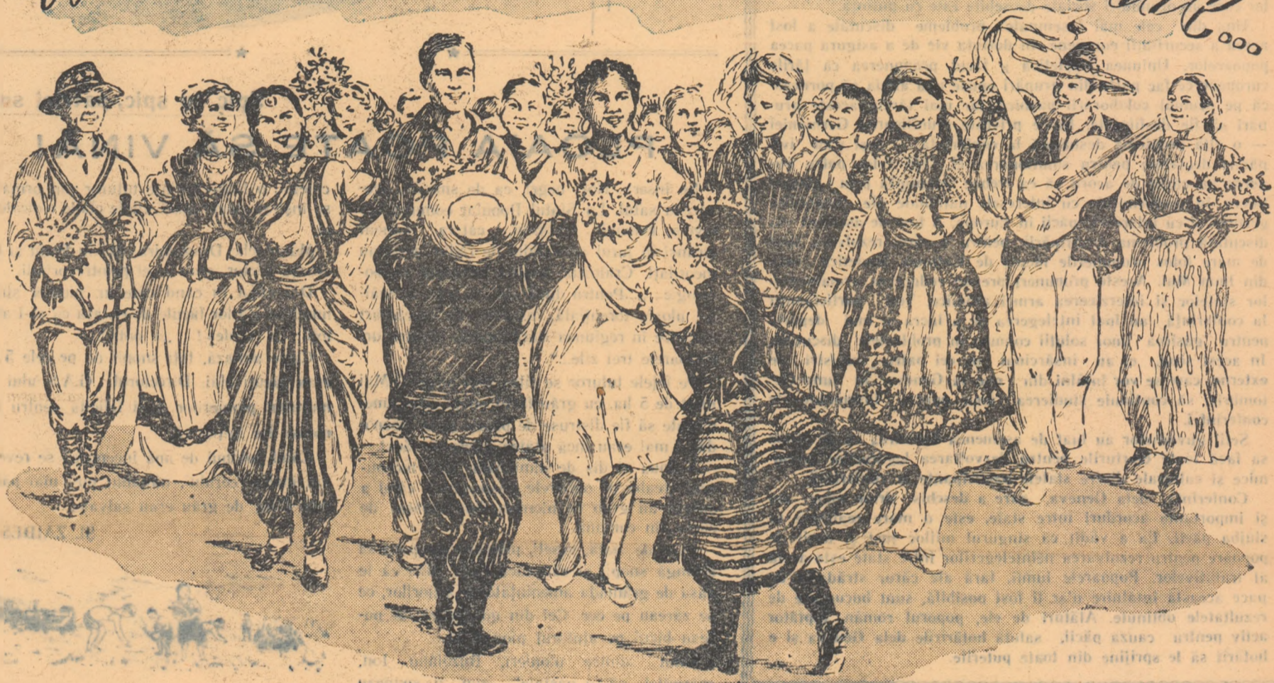
desen de Elta ZUKERMAN