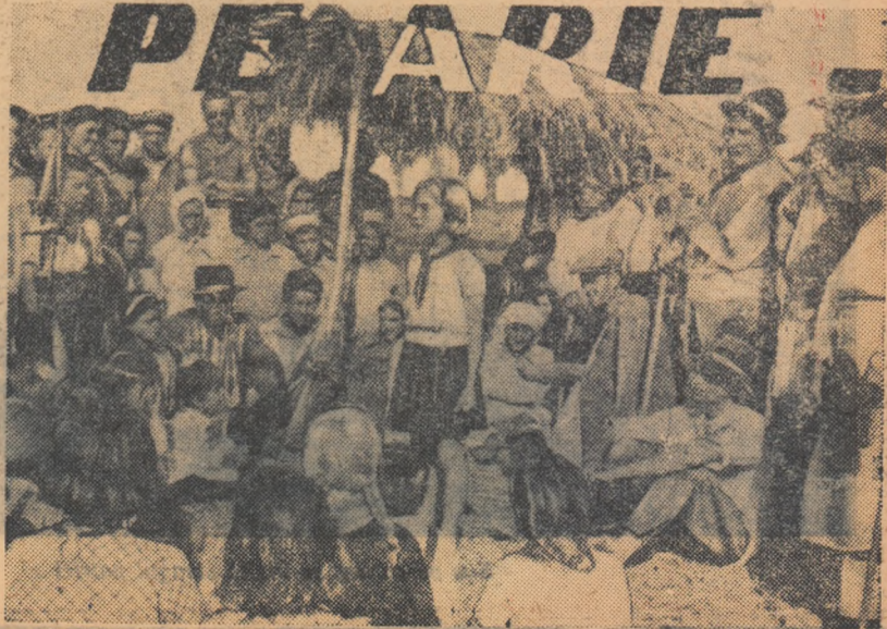
O clipă de răgaz. Echipa artistică a unității de pionieri din sat mple această clipă într'un chip cât se poate de plăcut.