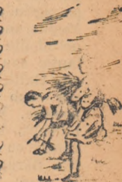
Colectivul de organizare al excursiilor Palatul pionierilor-Arad

Cele două excursii ne-au îmbogățit cu mult cunoștințele.