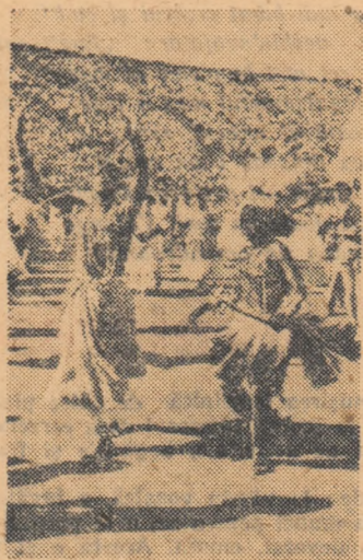
Numeroase țări de pe glob și-au trimis la Festival tineri care să facă cunoscute cântecul și dansurile lor minunate.

Sportivii noștri au adus astfel culorilor patriei victorii de mare răsunet.