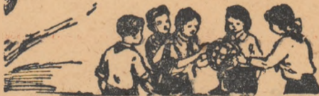
Un grup de pionieri din tabăra dela Alba Iulia