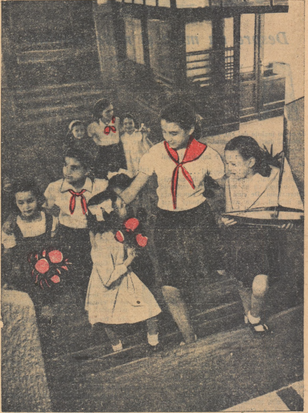
„Iată, aceasta e școala la care veți învăța și voi“... Cu multă prietenie au primit pionieretele din clasele mai mari oaspeții dragi — elevetele din clasa I-a.

Vă felicit cu prilejul acestei însemnate zile a începutului de an școlar și vă urez, dragi pionieri și școlari, spor la învățătură!