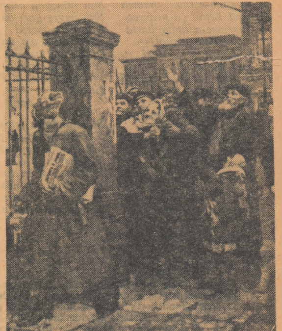
„PRIMUL DECRET“ Pictură de A. SEGALL

Detașamentul acesta avea misiunea ca, în noaptea de 23 spre 24 octombrie, să-i înfrîngă pe iunkerii de la școala militară „Konstantinovskaia“. Matrozii, care aveau multe răfuieli cu iunkerii, se bucurară mult de această misiune.