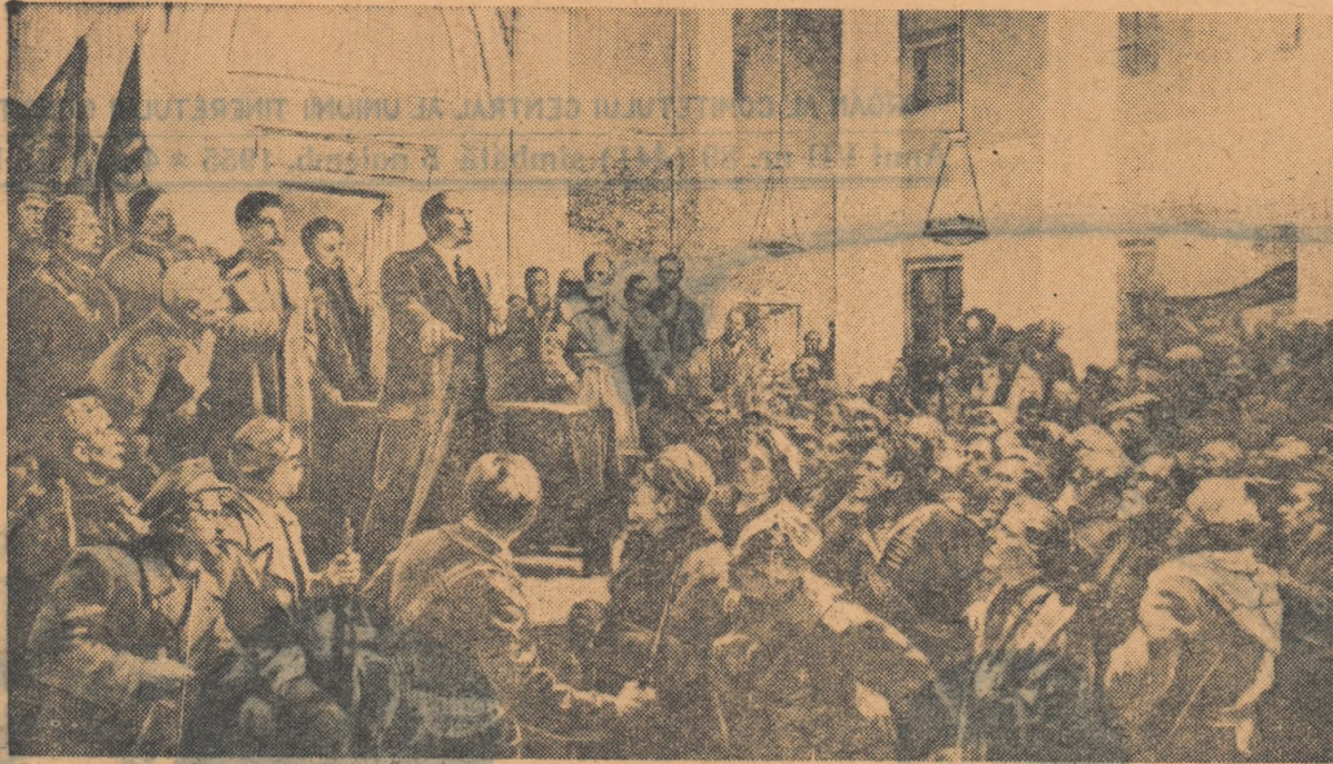
Putere Sovietelor — pace popoarelor! Tablou de: D. A. Nalbandian, V. N. Basov, N. P. Meșcianinov, V. A. Pribilovski, M. A. Suzdalțev.

...Iată-i cățărindu-se pe burlanele școlii, sărind pe geamuri, năvălind în clădire. Iunkerii au fost înfrinți. Apoi matrozii au primit ordin să ocupe oficiul telegrafic.