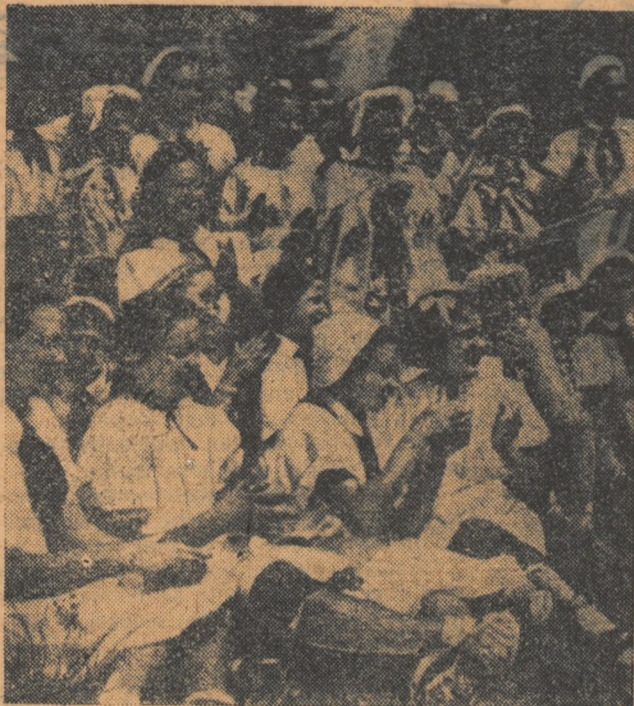
Artek-ul răsună întotdeauna de cele mai minunate cîntece și jocuri pionierești, pentru că acolo își petrec vacanța copii veniți din toate colțurile Uniunii Sovietice.

Pretutindeni, oamenii cinstiți din întreaga lume văd în pionieri niște copii curajoși, iubitori de țară, uniți puternic de un țel comun: acela de-a contribui după puterile lor la lupta pentru fericirea poporului.