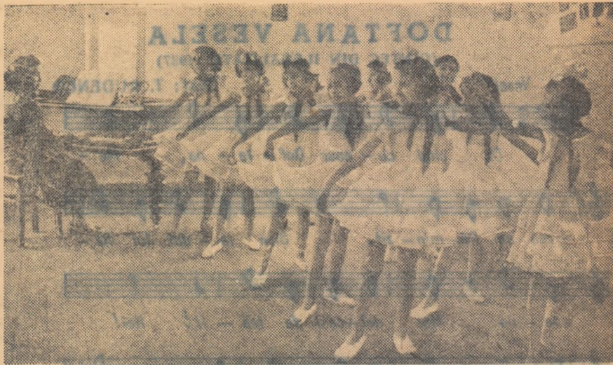
In acordurile armonioase ale pianului, mișcările vin parcă de la sine. An de an, la Casa pionierilor din Birlad, zeci și zeci de copii învață dansul artistic la cercul de coregrafie.