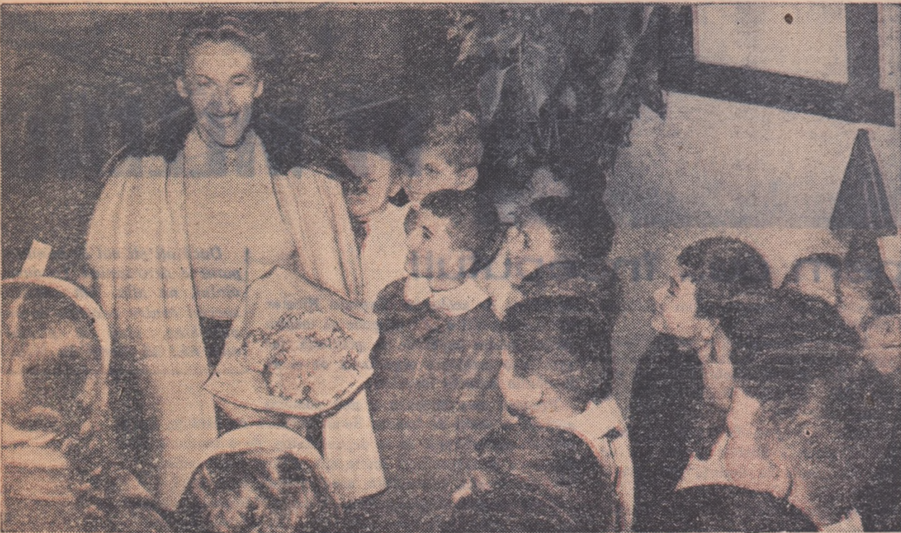
Adeseori scriitorii noștri vin în mijlocul cititorilor. Iată-o pe scriitoarea Nina Cassian stînd de vorbă cu micii cititori.

Anul VIII nr. 2 (458) miercuri 4 ianuarie 1956 * 4 pag. 15 bani