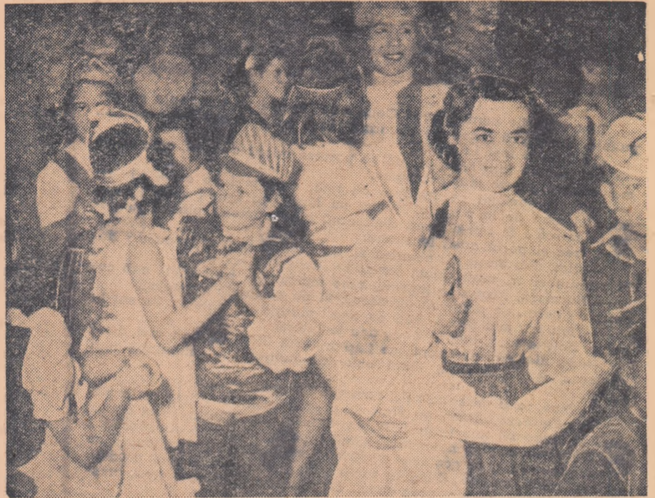
...Și acum să dansăm puțin! Un ie purăș cu o cazacă, o Cosinzeană cu un paj, se învîrtesc în ritmul unui vals. Iată, așa arată o după amiază de carnaval la Palatul pionierilor din București.