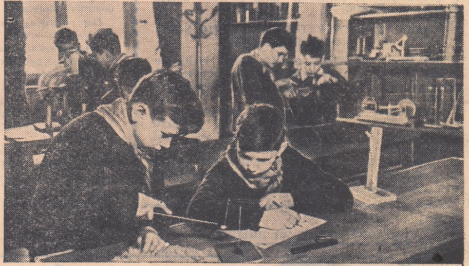
Repetînd lecțiile în laboratorul școlii e mai interesant și mai ușor

De aceea eu vă dau următorul sfat: rezervați de pe acum, în fiecare zi, cîte un ceas repetării materiei. Imbinați învățătura cu jocul, cu statul în aer liber. Acesta-i cel mai bun medicament împotriva uitării.