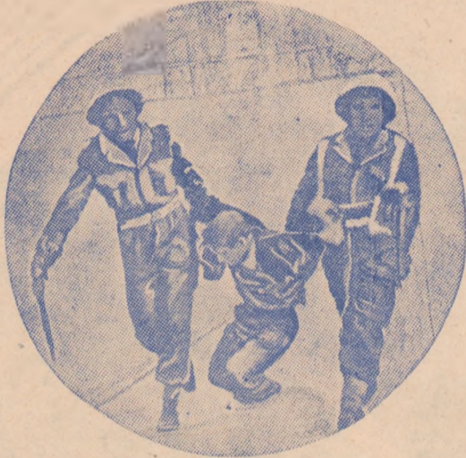
Un tînăr cipriot, arestat pe stradă, e trîntit cu forța la poliție.

În fața teroarei, ciprioții nu stau însă cu brațele încrucișate. Tineri și bătrîni, copii și femei, ei se împotrivesc eroic, din toate puterile. Zeci de demonstrații și greve au loc în orașele Ciprului. Cu toată paza strașnică, în zorii zilei zidurile caselor sînt pline de inscripții: „Englezii să se care acasă!”, „Mulți ciprioți fug în munți, în rîndurile partizanilor. Tot poporul participă la luptă. Cînd guvernatorul englez a închis — drept represalii — școala Samuel din Nicosia (capitala Ciprului), copiii din Paphos, la 200 km depărtare, au declarat grevă, părăsind pentru cîteva