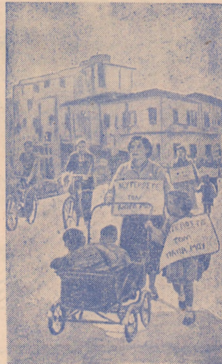
La Nicosia, soțiile și copiii militanților comuniști cer eliberarea acestora.