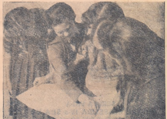
A apărut un număr nou

I-am întrebare pe cei care se joacă (dar într-un chip destul de folositor și serios) de-a redactorii dacă nu cumva doresc să devină ziaristi pe viitor. Desigur, o mare parte din ei au mărturisit că într-afîi au îndrăgit această muncă, înclt se vor