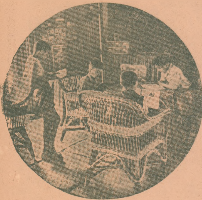
O carte bună — un prieten bun

Printre aceste probleme se vor discuta multe lucruri privitoare la literatura pentru copii. Și fără îndoială că discutarea lor va fi un îmbold pentru scrierea multor cărți frumoase pentru copii.