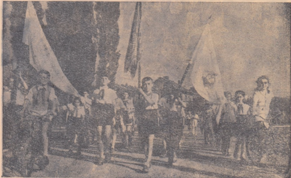
Un grup de pionieri defilind la Festivalul Tineretului din reg. Hunedoara

Partidul și Guvernul au distins și-n acest an un mare număr