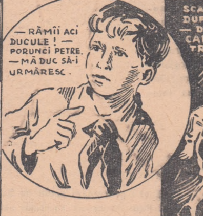
— RĂMIÎ ACI DUCULE! — PORUNCI PETRE. — MĂ DUC SĂ-I URMĂRESC.