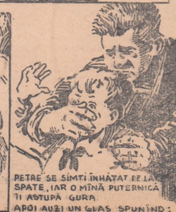
PETRE SE SIMȚI ÎNHĂȚAT RE LA SPATE, IAR O MÎNĂ PUTERNICĂ ÎI AȘTUPĂ GURA. APOI AUZI UN GLAS SPUNÎND: