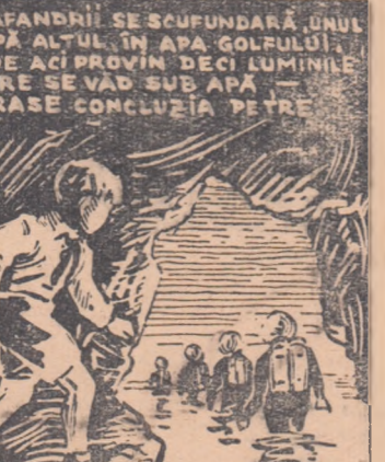
SCAFANDRII SE SCUFUNDARĂ UNUL DUPĂ ALTUL ÎN APA GOLFULUI. — DE ACI PROVIN DECI LUMINILE CARE SE VAD SUB APĂ — TRASE CONCLUZIA PETRE