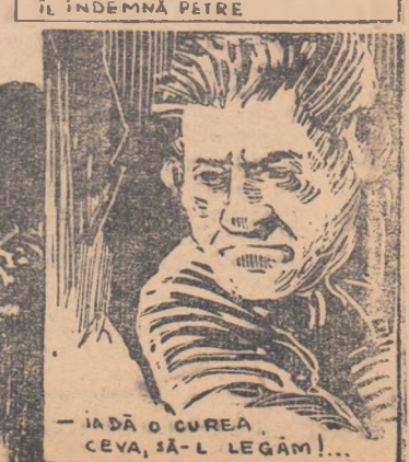
— IADĂ O CUREA CEVA, SĂ-L LEGĂM!...