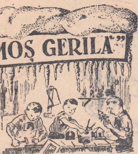
la cercul sportiv sau „mîini îndemnatice”. În sfîrșit, toți pregătesc surprize pentru carnavalul din seara de Anul Nou.

Dar și în celelalte cercuri ale Casei pionierilor se observă aceeași însușeală. Pionierii coriști, cei de la artă dramatică, de