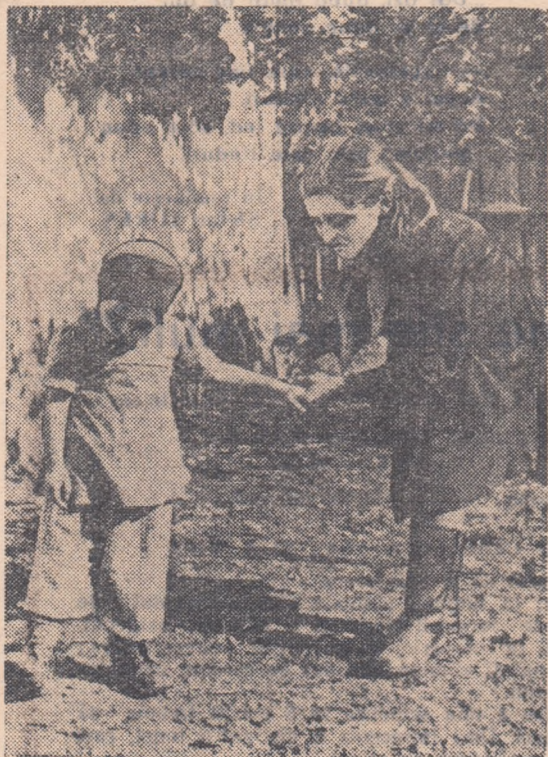
— „Și pe ghetușe te-ai murdărit? Ei să-ți le ștergi singur, că ești băiat mare.”

Dar, cu toate că cele două acte au plăcut nespuse de mult spectatorilor, aceștia așteaptă de acum, tot mai