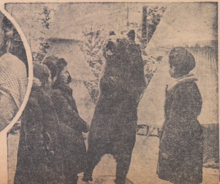
● Atenție, „năsuc” ărn! ● O vitrină, cîteodată, te farmecă mai mult decît un basm. ● Un „Moș Martin”...