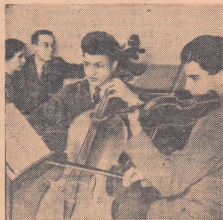
Pasiunea lor este muzica de cameră.

de harpă. Apoi l-am întîlnit pe maestrul Fănică Luca. Veșnic vesel și bine dispus, Fănică Luca, cu concursul cîtorva elevi, tocmai executa un program la nai.