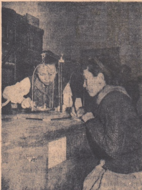
În fiecare zi elevii Școlii din Viștea de Jos vin în laborator unde fac fel de fel de experiențe.