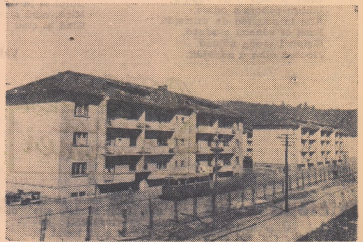
Blocuri muncitorești în Lunca Pomostului