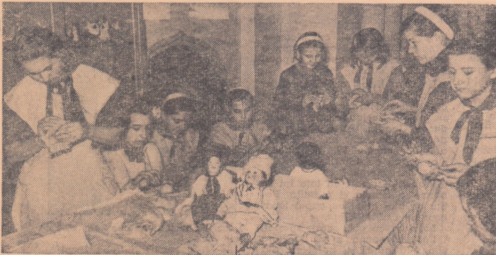
La cercul de miini îndeminatice se lucrează păpuși

Unitatea de pionieri de la Școala de 7 ani Girbov raionul Urziceni