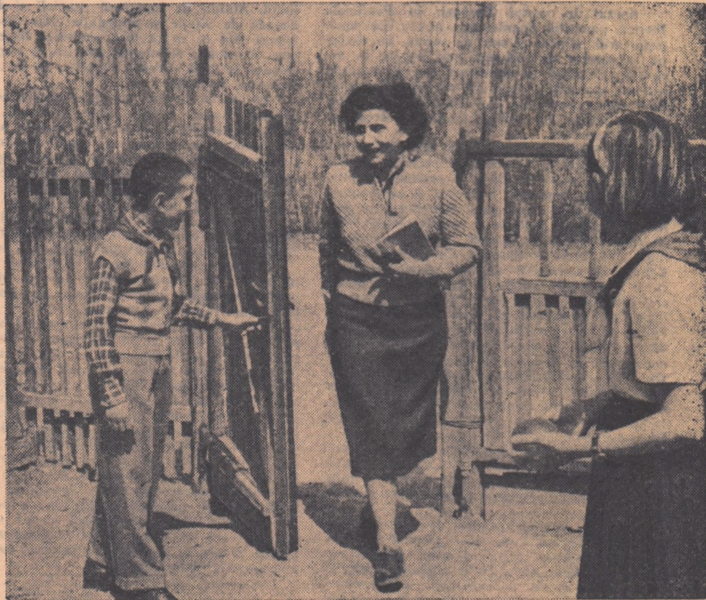
„POFTIȚI, POFTIȚI, TOVARAȘA PROFESOARA!”

ORGAN AL COMITETULUI CENTRAL AL UNIONII TINERETULUI MUNCITOR Anul VIII nr. 30 (590) * sîmbătă 13 aprilie 1957 * 4 pag. 15 bani