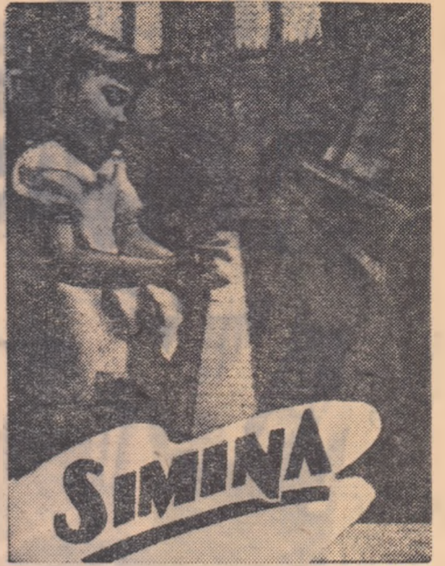
Au trecut aproape doi ani de atunci. Era într-o după amiază de mai, cînd Simina se așeză la pian și începu să cînte o bucată pe care o auzise la fratele ei.

Eugen, fratele ei mai mare, care o ascultase cu emoție, alergă într-un suflet la mama sa.