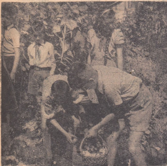
Recoltă bogată pe lotul școlar...