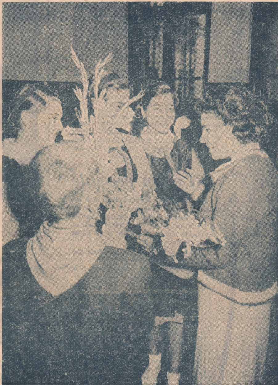
— Bine v-am găsit, tovarășă profesoară! Dar mai bine decât vorbele copiilor de la Școala medie nr. 2 Ploești, vorbesc florile lor, aduse în dar profesoarei lor dragi.

Anul VIII nr. 57 (617) * joi 19 septembrie 1957 * 8 pag. 30 bani