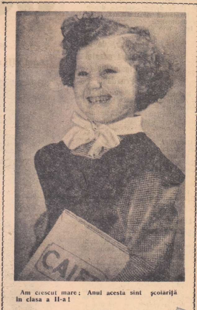
Am crescut mare; Anul acesta sînt școlăriță în clasa a II-a!

Se pot spune multe lucruri despre fiecare concurent, despre fiecare scrisoare. Dar voi sînteți curioși să cunoașteți mai repede întreaga listă.