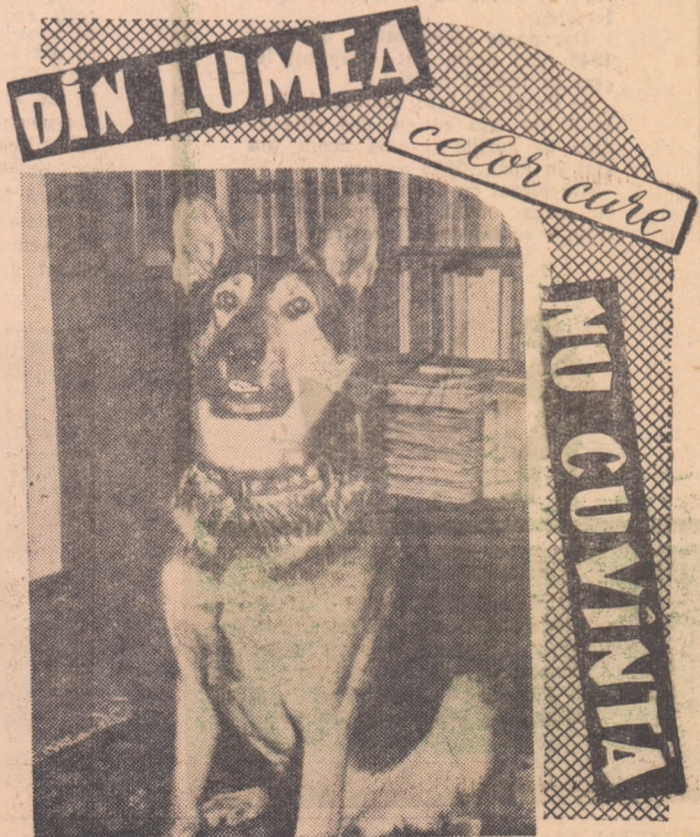
Dago, nu cuvîntă e adevărat, Asta nu l-a împiedicat însă să joace în mai multe filme.

La 26 octombrie, postul de radio al satelitului, epuizîndu-și rezervele de energie electrică, a încetat să funcționeze. În aceste condiții devin de o mare importanță observațiile optice care vor constitui mijlocul principal pentru măsurarea elementelor orbitei satelitului și rachetei purtătoare, precum și pentru determinarea mișcării lor probabile.