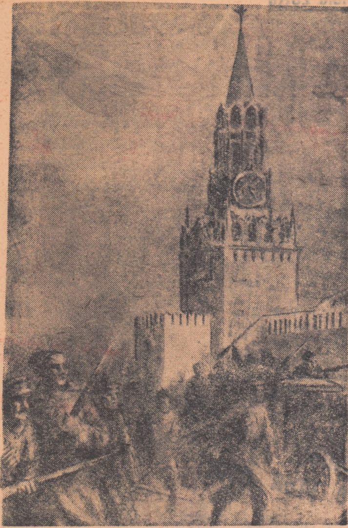
Desen de A. ERMOLIOEV (fragment) Revoluția din Octombrie la Moscova

(Fragmente din volumul „Amintiri ale foștilor voluntari romini din Armata Roșie în timpul Marii Revoluții Socialiste din Octombrie și al războiului civil” apărut în Editura de stat pentru literatură politică).