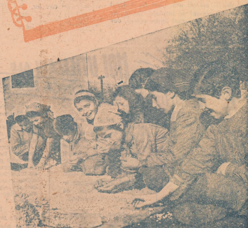
Pionierii au sosit să ajute la alegerea șimintei (G.A.S.-Găiești).

Așa că, la plecare le-am spus amicilor mei dintr-a VI-a: — Hei, voi, „englezilo”! Nu vă tociți mintea chiar așa... Așeti în vedere proverbul enelez „Much work and no play makes Jack a dull boy” (Adică, tradus mai liber, ar veni cam așa: „munca multă și joaca puțină fac din Jack un copil morocănos”). Bineînțeles, i-am lăsat pe cei care s-au săt de conținut pe conținut.