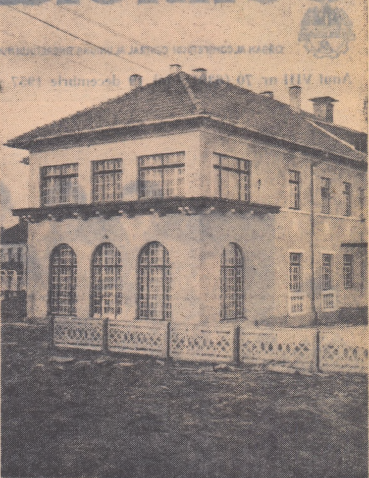
În orașul Victoria, o nouă construcție: Căminul săptămînal de copii.