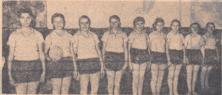
Echipa de volei a colectivului sportiv „Fulgerul”