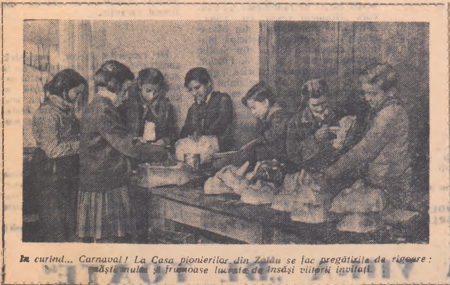
În curînd... Carnaval! La Casa pionierilor din Zalău se fac pregătirile de rigoare: măști, muză și frumoase lucruri de însăși viitorii invitați.

cl. a VII-a, Școala de 7 ani nr. 5 Craiova