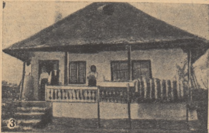
1. Alexandru Ioan Cuza, alături de Mihail Kogălniceanu, istoric de frunte și însemnat om politic, unul dintre cei mai înfocârați unioniști. 2. Stema orașului Focșani, simbolizînd Unirea Țărilor Române. 3. În această casă simplă din comuna Cimpuri s-a născut Moș Ion Roată, deputat al țărănilor moldoveni în Divanul Ad-hoc.

Noi urale însoțite de joc și cîntece, era magnific!”