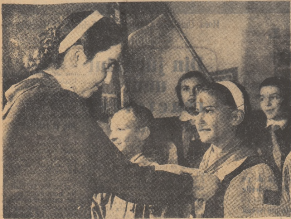
O clipă de nemărit pentru pionierii care fac parte din „Promoția Centenarului Unirii”: primirea cravatei roșii.