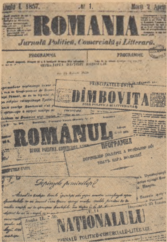
Ziare ale timpului, care au militat pentru Unire.