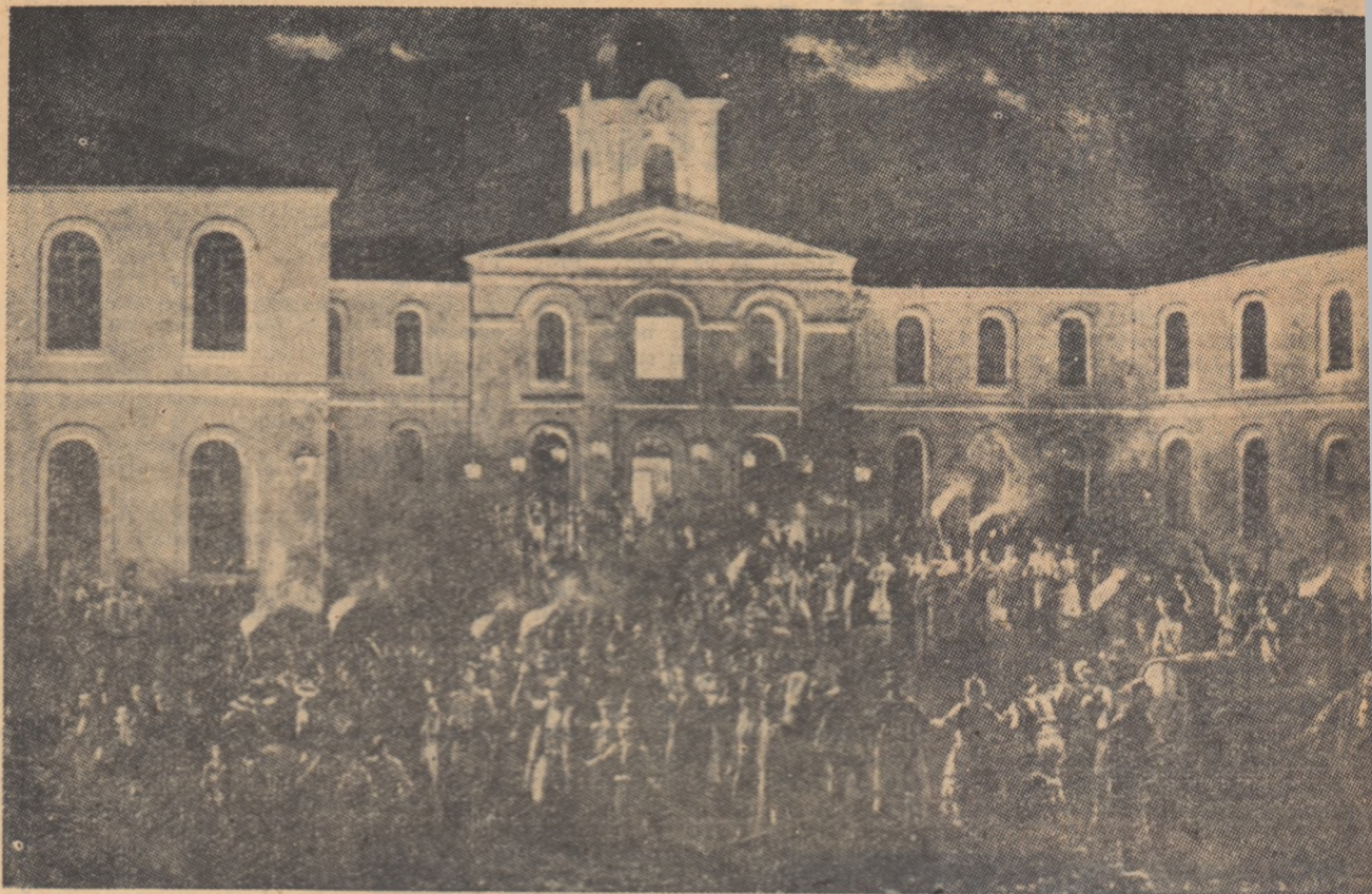
Hora Unirii la Craiova Tablou de Theodor Aman