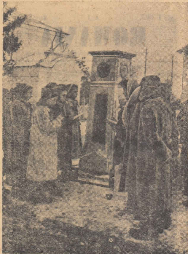
În amintirea hotarului care despărțea Moldova de Țara Românească, în centrul orașului Focșani, se află acest monument ridicat pe locul unde odinioară se afla pichetul de grăniceri nr. 47.

LATIȘ SUZANA președinta detașamentului nr. 4