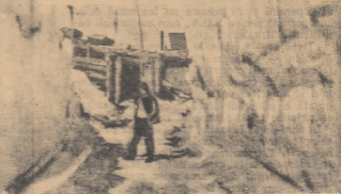
Să străbăți întinderile inzăpezite ale Antarcticii nu-i ușor... Uneori, trebuie să-ți croiești drum străvîngind cu buldozerul patarile înalte de zăpadă. Lucrul acesta îl fac adesea membrii expediției sovietice pentru a-și putea continua rodnicele lor cercetări.