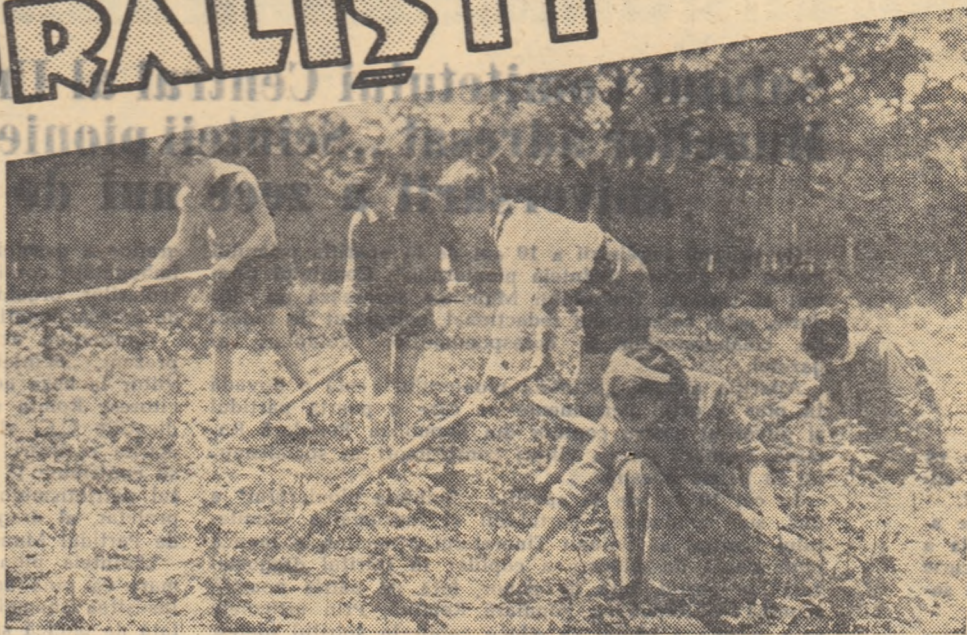
Pe lotul școlar al Școlii de 7 ani nr. 112 din București, pionierii din clasa a V-a și a VI-a îngrijesc de cei peste 2.000 de puieți de pomi fructiferi și arbori decorativi.

În ziua aceea grupul pionierilor a avut de plivit un ha de ceapă. De îndată ce au sosit acolo, fiecăruia detașament i s-au repartizat cî-