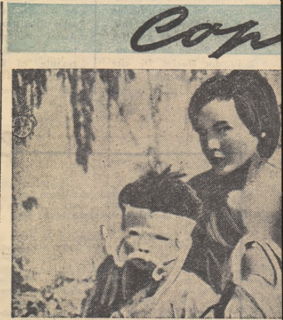
Copii japonezi, victime ale bombei atomice, cerșind