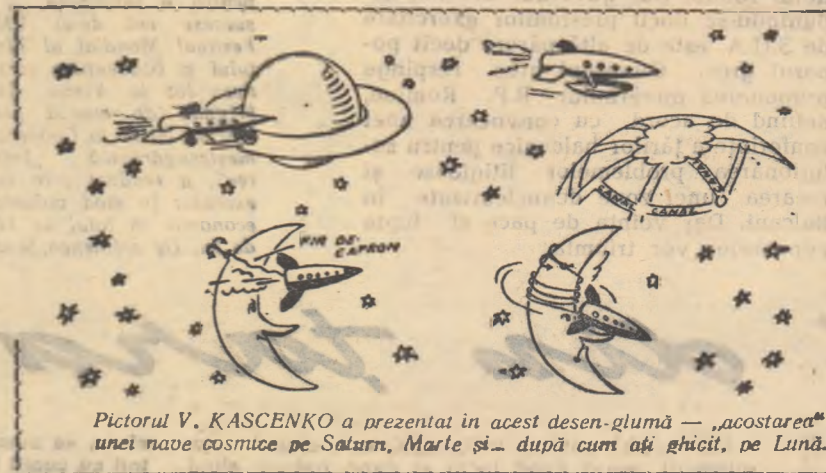
Pictorul V. KASCENKO a prezentat în acest desen-glumă — „acostarea” unei nave cosmice pe Saturn, Marte și... după cum ați ghicit, pe Lună.

Și astfel, uluitorul ritm în care se succed una după alta biruințele științei moderne ne îndreptășesc să spunem că următorul deceniu va fi leagănul unui eveniment de o importanță covârșitoare: celor șase continente pămîntești li se va adăuga al șaptelea — Luna.