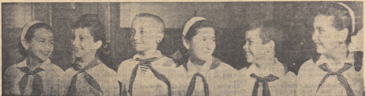
Prima zi de examen în clasa a IV-a s-a terminat cu bine!