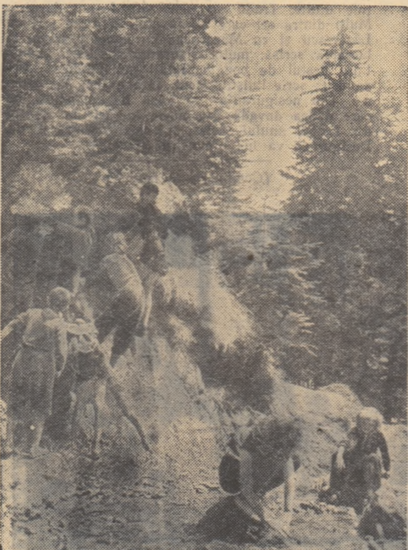
Încet să privești mai înlăuntru... Noutăți — la tot pasul...